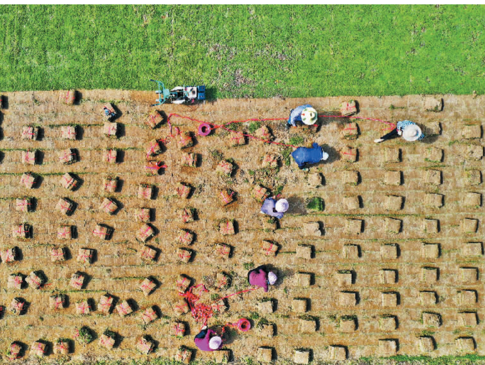
11月10日，江西省永丰县恩江镇郭家村农民在采收草皮，准备装车外销。近年来，该县紧扣城乡环境绿化市场需求，推行“党支部+基地+农户”经营模式，通过土地流转规模发展草皮种植产业，带动当地农民绿色增收生态致富。

在今年全国两会上，全国人大代表、全国劳模、中建五局总承包公司项目质量管理员邹彬建议，加强职业教育和技能培训，推动“农民