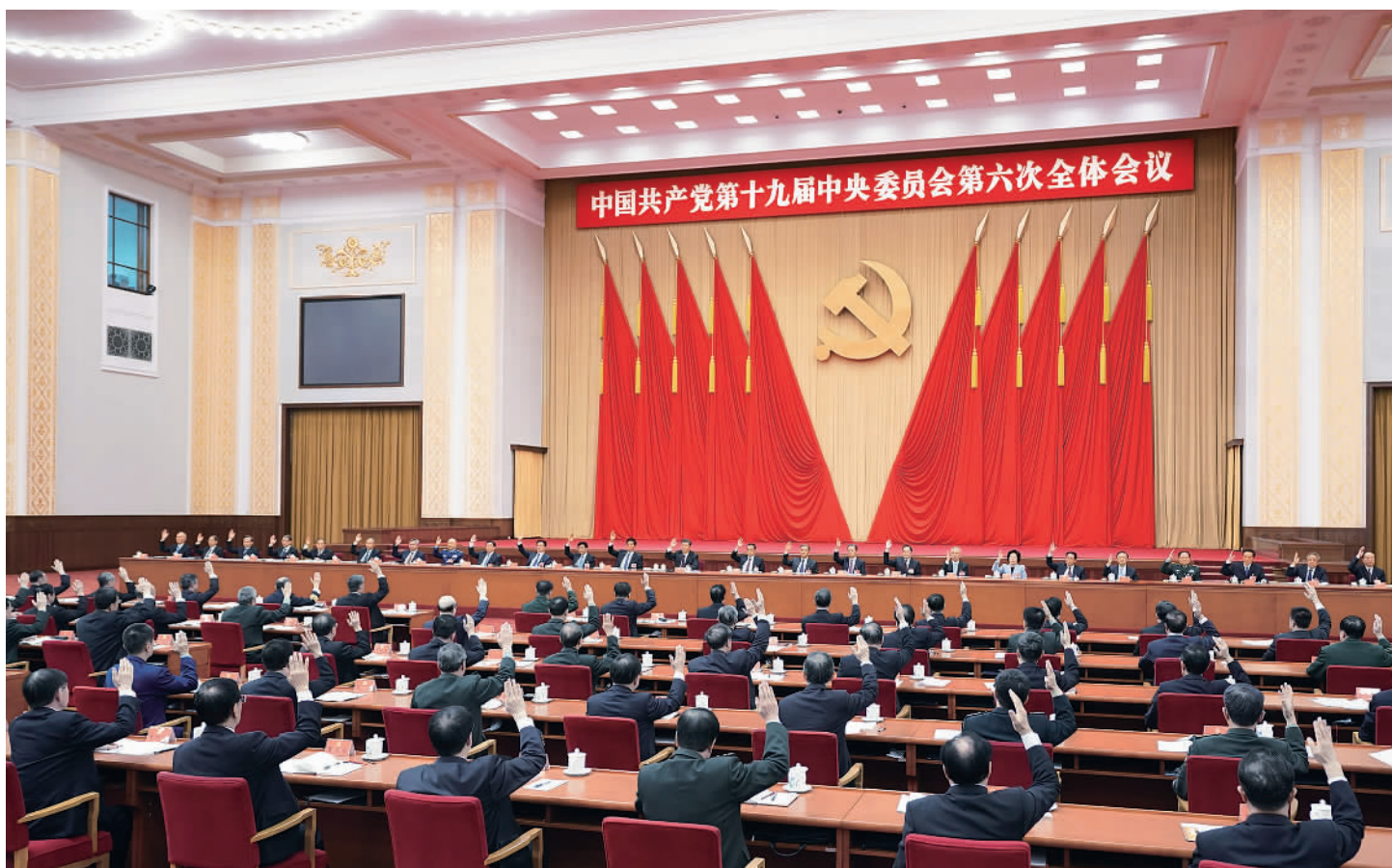
中国共产党第十九届中央委员会第六次全体会议,于2021年11月8日至11日在北京举行。中央委员会总书记习近平作重要讲话。