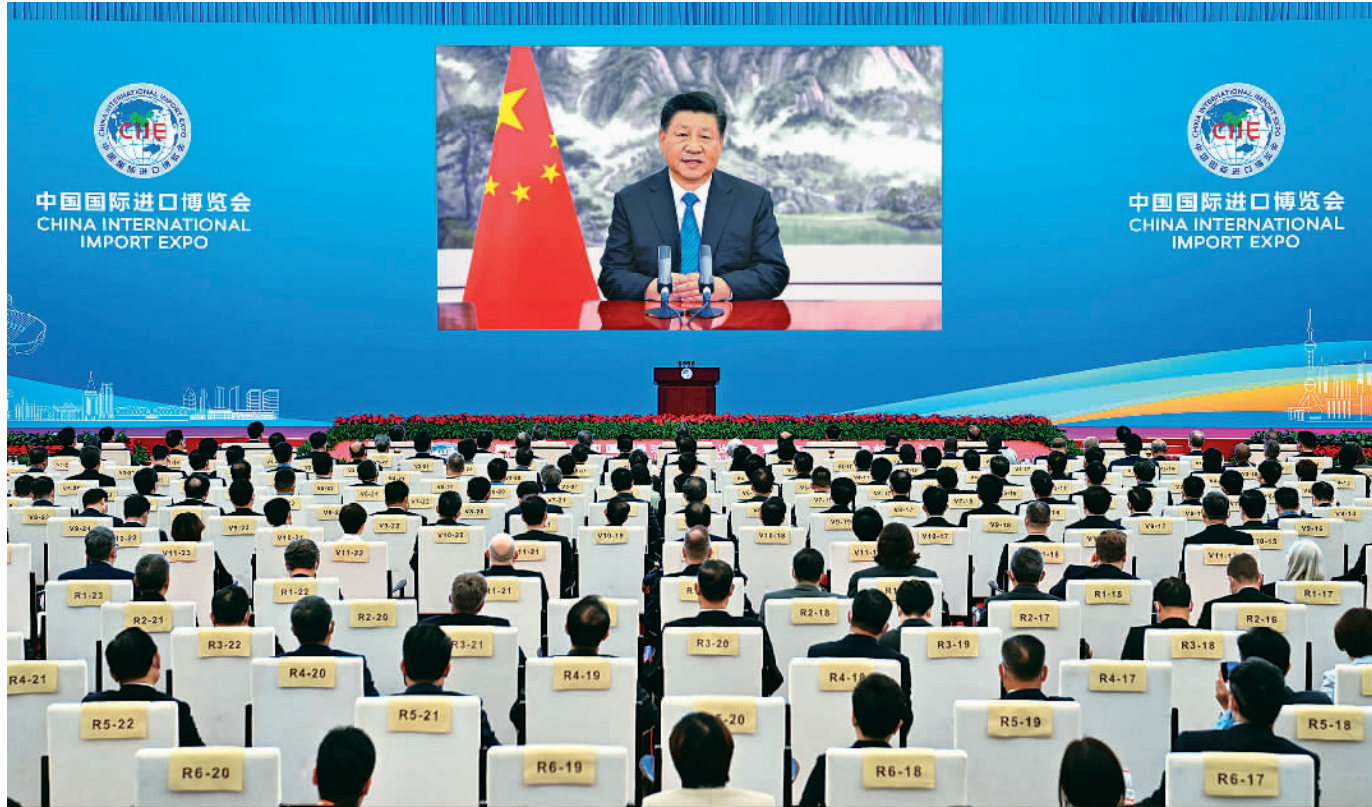
11月4日晚,国家主席习近平以视频方式出席第四届中国国际进口博览会开幕式并发表题为《让开放的春风温暖世界》的主旨演讲。