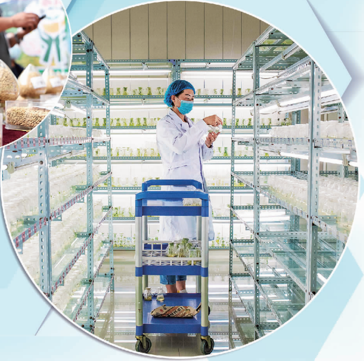
右图 员工在内蒙古丰种业有限公司资源库保存马铃薯脱毒资源苗。 近年来,乌兰察布持续加大科研投入,积极推进马铃薯育种产业化发展,实现了种薯智能化、工厂化、标准化生产。