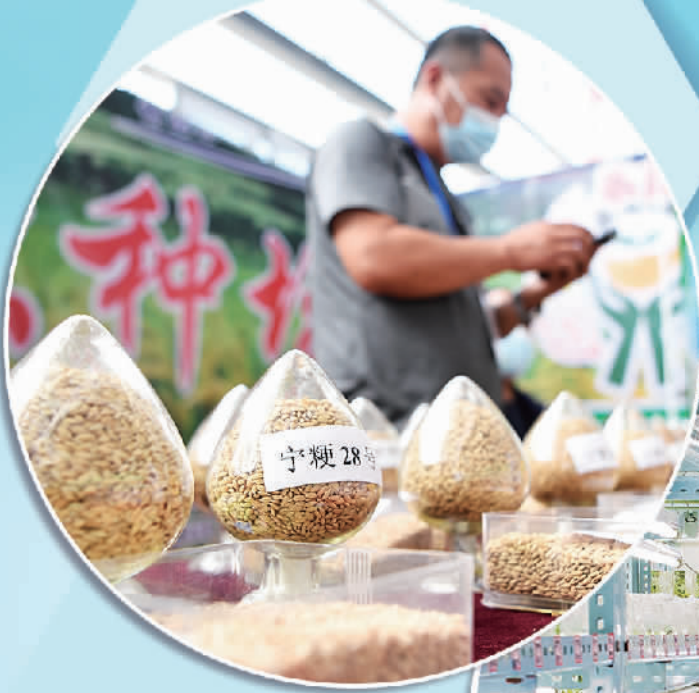
上图 第八届宁夏种业博览会展出350余家企业的4000余个品种的种子产品,为制种产业发展、农户科学选种搭建平台,让种子打开大市场。