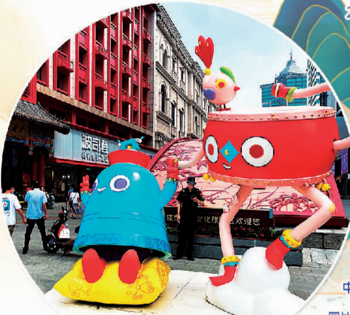
沈阳中街的“嘎钟哥”“哈鼓妹”等卡通“萌物”受到游客喜爱。

清代官帽、花盆底鞋、满族纹饰……独具特色的满清文化符号，配上“嘎钟哥”“哈鼓妹”等卡通“萌物”，成为中街的全新品牌形象。不少游客也纷纷与这些中街“代言人”合影。