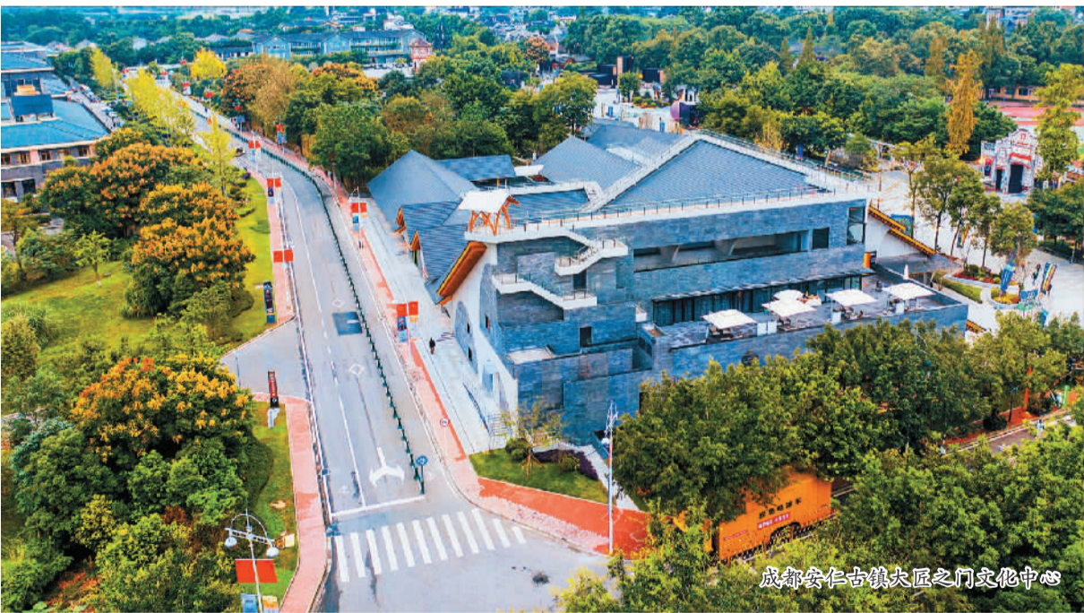
成都安仁古镇匠人之门文化中心

安仁古镇的华丽蝶变只是华侨城助力乡村振兴的一个缩影。2012年以来，华侨城确立“文化+旅游+城镇化”