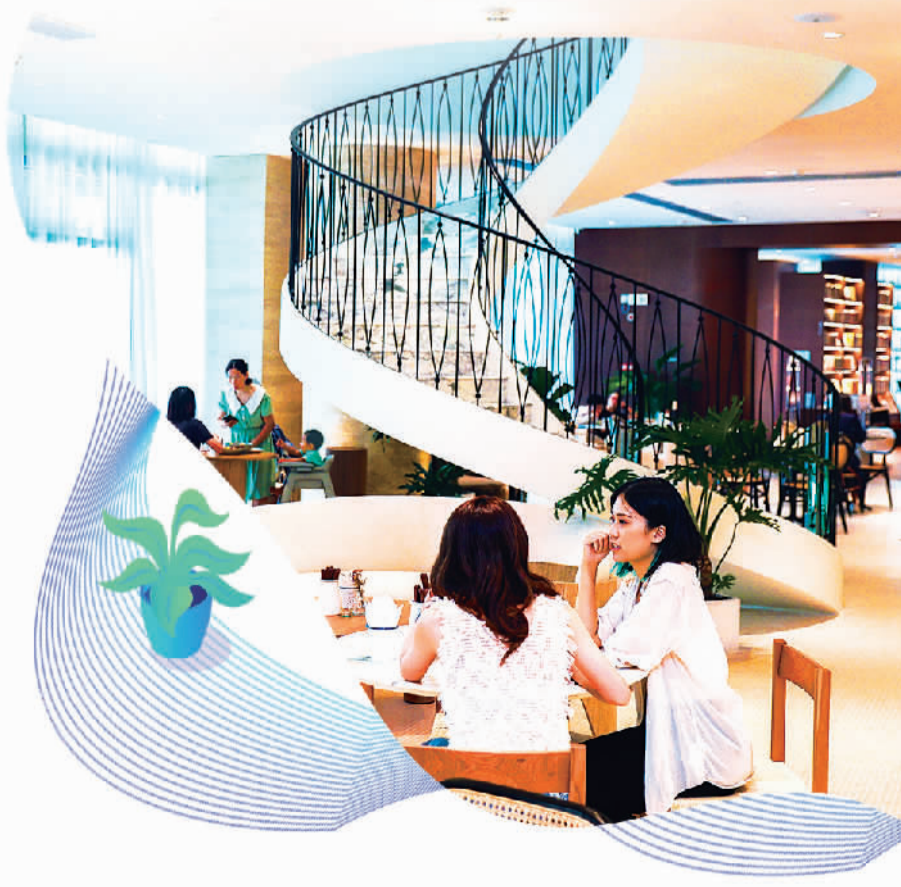
下图“Timetable”咖啡+美食+图书创新空间成为广州南沙文艺青年必去的“打卡点”。

南沙制定了港澳应届毕业生“职场菁英”就业计划，在事业单位、法定机构、国有企事业单位开发超百个竞争力强、薪资水平高、吸引力大的就业岗位，累计促成12名港澳青年在南沙就业。同时，南沙机关企事业单位面向港澳青年开展定向招录，共有11名港澳青年在区商务局、区政数局、区产业园管理局和区开发建设集团任职，实现“港澳所长”与“湾区所需”“南沙所能”有机结合。