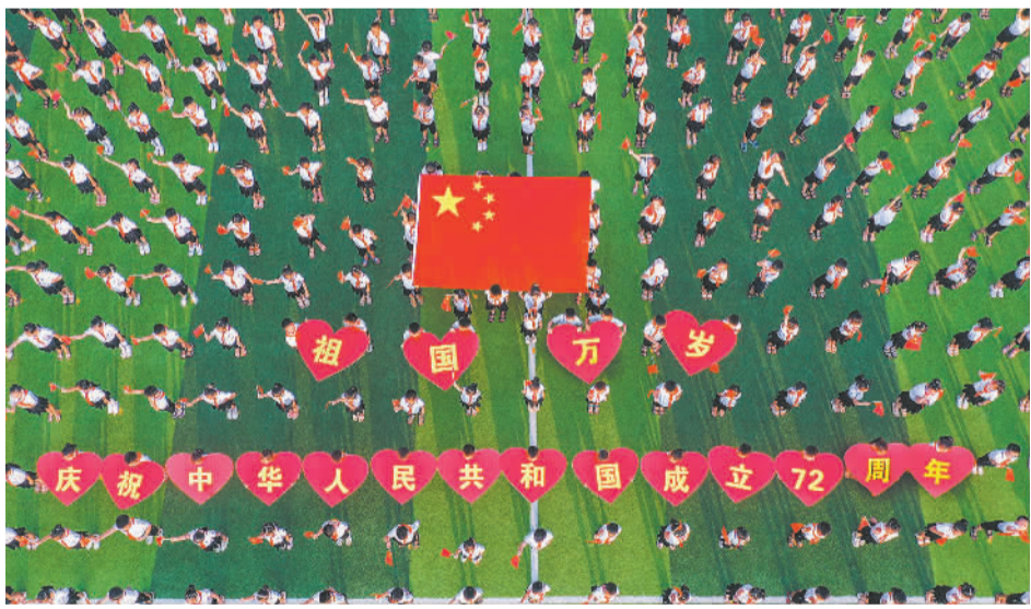
9月29日,江西樟树市清江小学举行“童心向党 歌唱祖国”活动。连日来,樟树市举办丰富多彩的文化活动,共同庆祝新中国72岁生日。