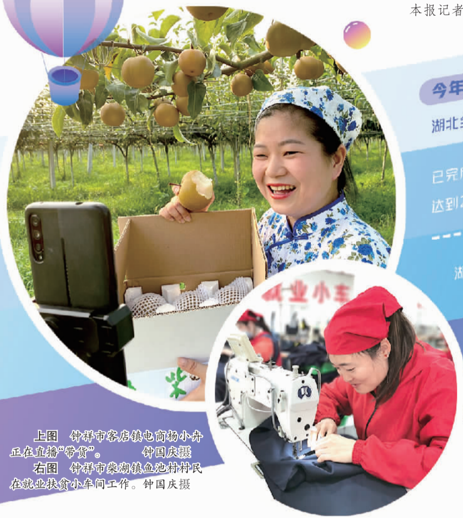
上图 钟祥市客店镇电商物小舟正在直播“带货”。钟国庆摄 右图 钟祥市梁湖镇鱼池村村民在就业扶贫小车间工作。钟国庆摄

已连续10年 实施“湖北省大学生创业扶持项目” 省级安排 3000万元 对大学生创业给予2万元至20万元无偿扶持