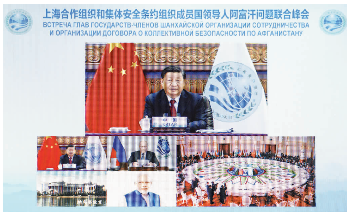
9月17日,国家主席习近平在北京以视频方式出席上海合作组织和集体安全条约组织成员国领导人阿富汗问题联合峰会并发表重要讲话。

习近平强调,一国的事情由本国人民做主,国际上的事情由大家商量着办。我们要在尊重阿富汗主权、独立、领土完整前提下,协助贯彻“阿人主导、阿人所有”的基本原则,让阿富汗各族人民自主掌握国家前途命运。上海合作组织