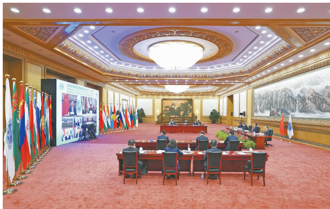
9月17日,国家主席习近平在北京以视频方式出席上海合作组织成员国元首理事会第二十二次会议并发表重要讲话。

新华社北京9月17日电 国家主席习近平17日下午在北京以视频方式出席上海合作组织成员国元首理事会第二十二次会议并发表题为《不忘初心 砥砺前行 开启上海合作组织发展新征程》的重要讲话。(讲话全文见二版)