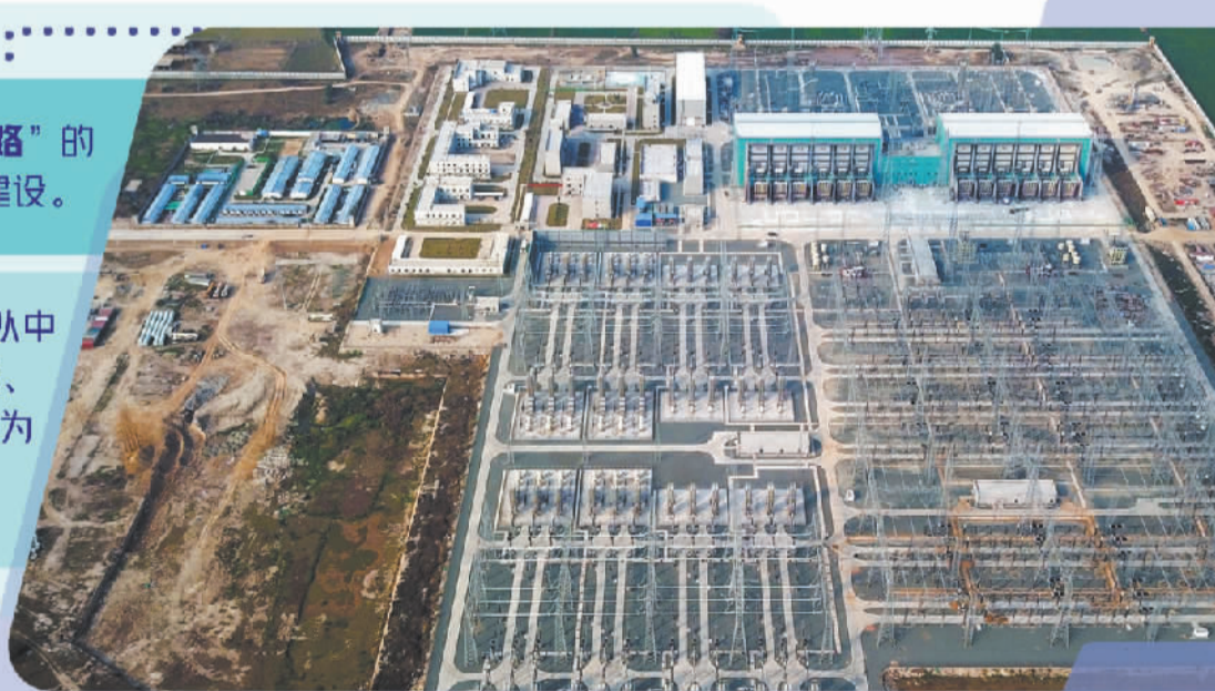
中巴经济走廊默拉直流输电工程拉合尔换流站全景。