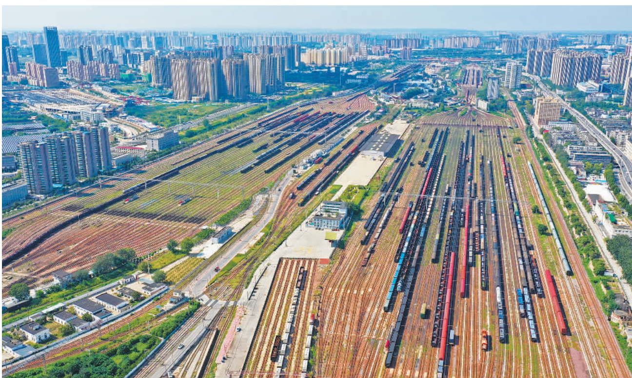
9月8日，一列完成编组作业的货物列车在郑州北站整装待发。连日来，中国铁路郑州局集团有限公司保障货物快装快发，加速助力地方经济恢复发展。

“围绕习近平主席在第17届东博会、峰会开幕大会上提出的‘四个提升’倡议，本届东博会、峰会将策划中国—东盟建立对话关系30周年等系列活动。”广西壮族自治区副主席刘宏武说。（下转第二版）