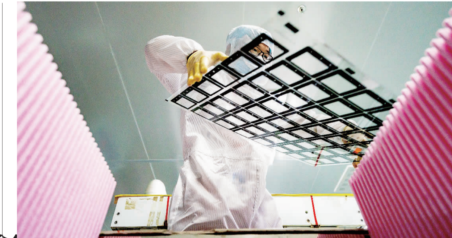
9月7日,江西沃格光电公司的技术人员在工控产品镀膜生产线上作业。该公司以玻璃精细加工和特种镀膜为核心技术优势,产品广泛应用于移动智能终端、可穿戴设备以及车载、工控领域。近年来,江西省积极培育光电产业,带动光电新材料研发及智能制造蓬勃发展。

“要严格落实政府举债终身问责机制和债务问题倒查机制,防范化解地方政府隐性债务,避免系统性风险。防范化解隐性债务风险成为打好三大攻坚战的重要内容,必须进一步严防隐性债务增量,积极稳妥做好化债工作。”罗志恒说。