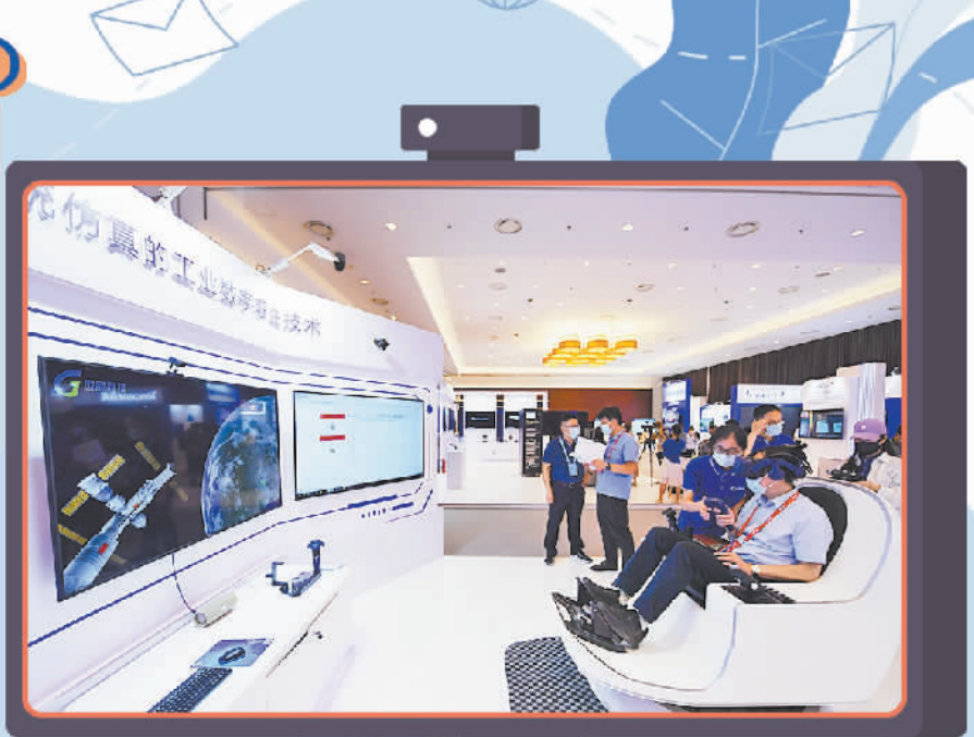
参观者在2021全球数字经济大会上体验工业数字孪生技术。

值得一提的是,中老年网民成为规模增速最快的群体。2020年以来,相关部门大力推动互联网应用适老化水平及特殊群体的无障碍普及。在政府、企业、社会各方共同