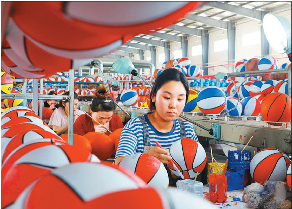
▲江苏泗洪经济开发区昆仑体育车间,员工在加工体育用品。全民健身的兴起,带动了体育用品的热销。