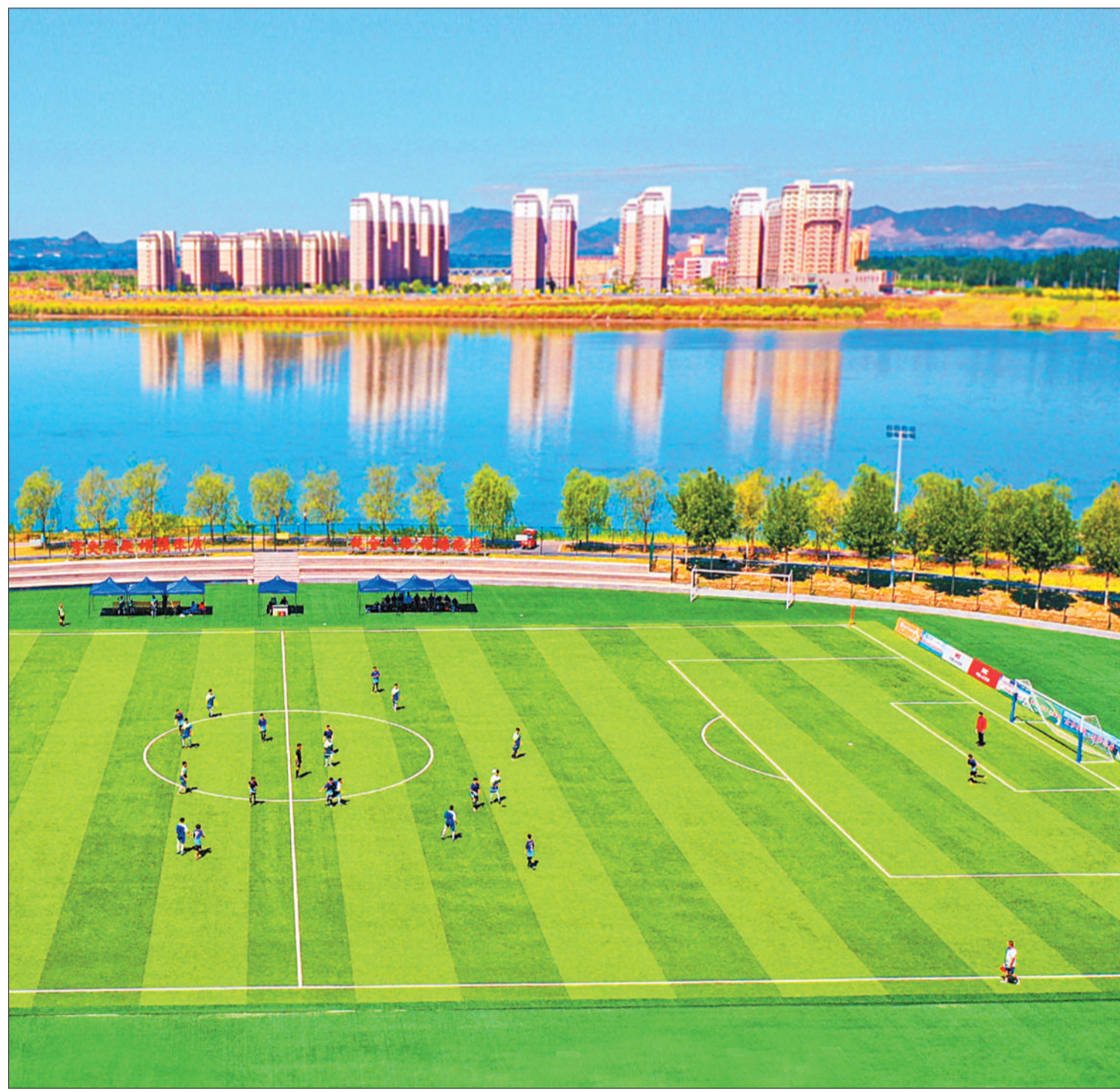
▲河北迁安市伟华青少年足球训练活动中心,中学生正在进行足球比赛。近年来,迁安市利用城市公园,引入集观景、健身、休闲等功能于一体的文化体育项目,体育产业蓬勃发展。