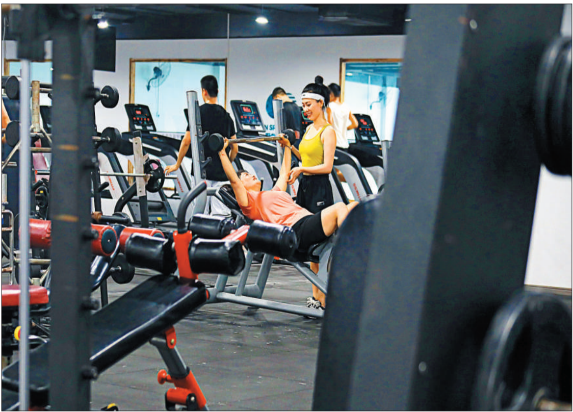
▼市民在江西宜春县佰盛广场原地点健身运动中心健身锻炼。全民健身的热潮让百姓纷纷走进公共健身场所、健身培训场馆,享受健身运动带来的健康和快乐,也促进了当地健身经济的快速发展。何贱来摄(中经视觉)