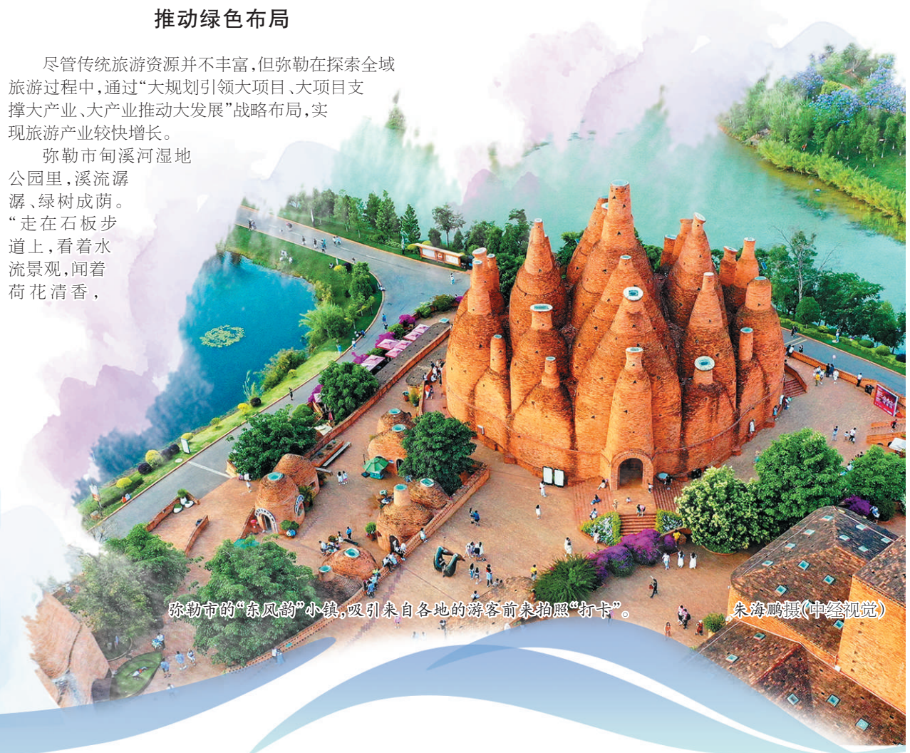
弥勒市的“东风韵”小镇，吸引来自各地的游客前来拍照“打卡”。