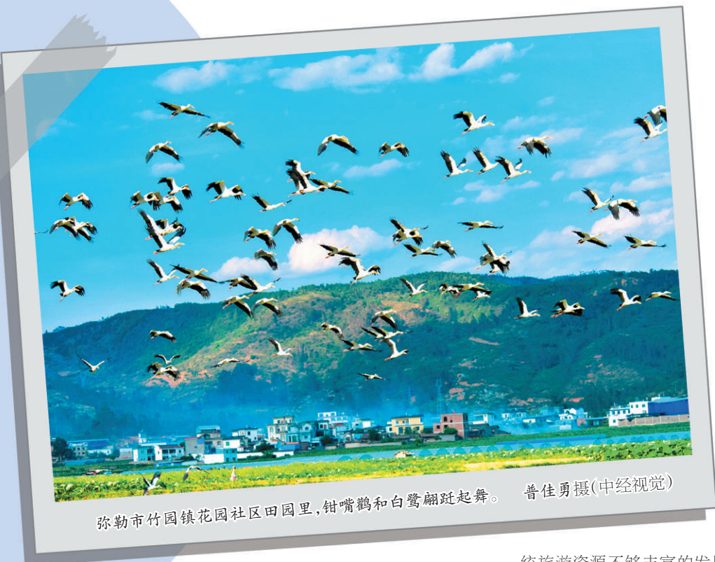
弥勒市竹园镇花园社区田园里，钳嘴鹳和白鹭翩跹起舞。

新冠肺炎疫情背景下，全球文旅产业发展面临更加严峻的挑战。对此，云南提出要打造世界一流“健康生活目的地”，加快全域旅游、康养小镇、大健康特色小镇建设，推动文旅产业朝着国际化、高端化、特色化、智慧化全面转型升级。这是云南旅游产业彻底改变观光游、购物游、低价游的一场真正意义上的旅游革命。