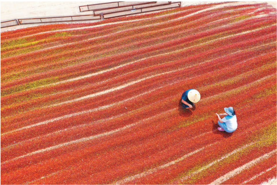
8月17日,山西运城城市新绛县北张镇北杜坞村逢明中药材专业合作社,社员在晾晒丰收的中药材酸枣。处暑将至,运城市秋收秋播秋种即将拉开序幕。连日来,农民抓紧农时,加强田间管理,抢收作物,乡村一派繁忙景象。

“在我国资本市场改革提速、市场环境日益成熟的过程中，A股市场国际投资者的吸引力稳步提升，外资加力布局中国市场是大势所趋。”粤开证券研究院首席策略分析师陈梦洁表示，北向资金的持续流入能够为市场注入优质增量资金，由于北向资金大部分为专业机构投资者，还能促使A股市场