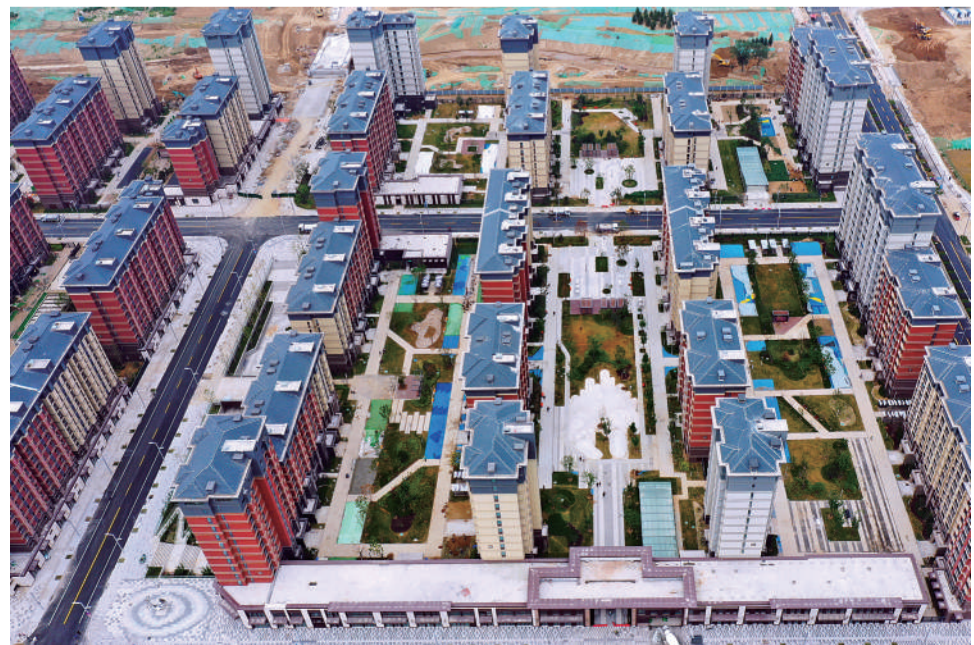
河北雄安新区容东片区G组团安置房及配套项目进入收尾阶段(8月12日摄,无人机照片)。作为河北雄安新区首批安置房项目,G组团共计126栋、6759套安置房,预计可回迁居民1.65万人。

新版汽车三包规定进一步强化生产者的质量责任,要求生产者不得故意拖延或无正当理由拒绝销售者、修理者提出的协助、追偿等事项。