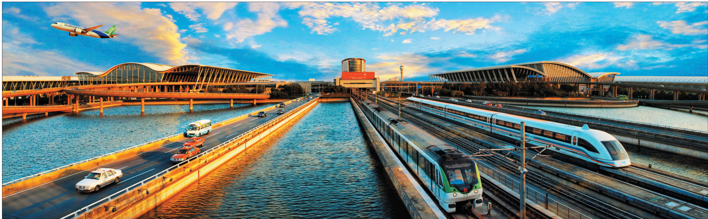
▲磁悬浮、地铁等立体交通建设的实施，让浦东国际机场为长三角地区和市域范围内的旅客提供了更便捷和多样化的交通出行选择。