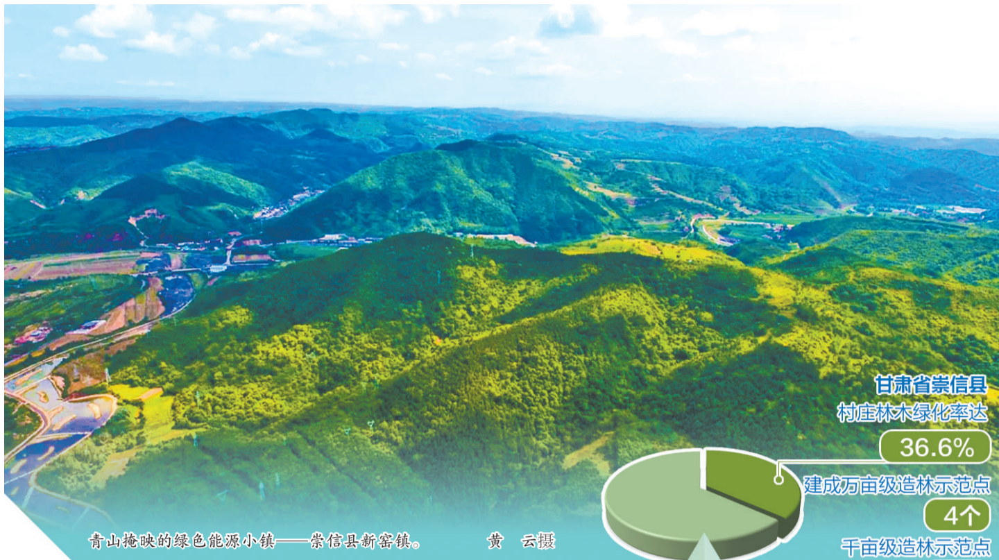
青山掩映的绿色能源小镇——崇信县新窑镇。

此外,崇信县在古树名木保护方面不遗余力。建档在册的古树名木有193棵,每逢看见参天如云或枝繁叶茂的前朝古树,人们不禁感叹这座城市的沧桑厚重。