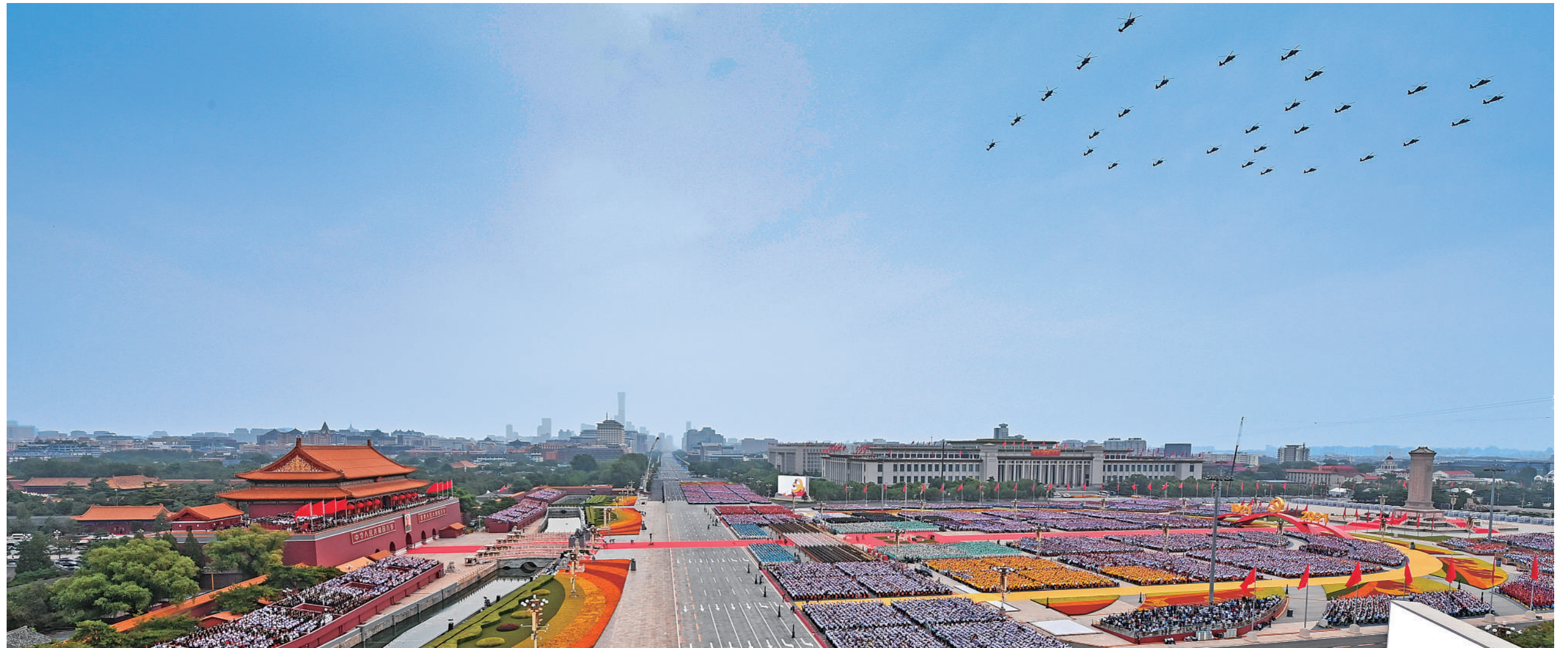
七月一日，庆祝中国共产党成立一百周年大会在北京天安门广场隆重举行。

神州大地欣欣向荣、气象万千，首都北京花团锦簇、旗帜飘扬。在伟大的中国共产党领导下，近代以后久经磨难的中华民族迎来了从站起来、富起来到强起来的伟大飞跃，14亿多中国人民正意气风发走在中国特色社会主义新时代的壮丽征程上。 (下转第三版)