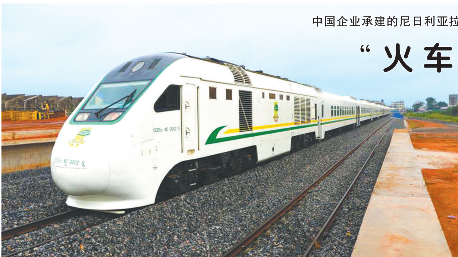
在尼日利亚拉格斯火车站，拉伊铁路旅客列车停靠在站台边。

中国驻尼日利亚大使崔建春在开通仪式上说，中尼建交50年来，两国关系全面快速发展，务实合作成果丰硕，拉伊铁路项目的落成启用是两国友谊的又一例证，体现了中国对尼日利亚经济社会发展的支持。中方将继续秉持正确义利观和真实亲诚理念，同尼方携手努力，奏响更加优美的“一带一路”合作交响乐。