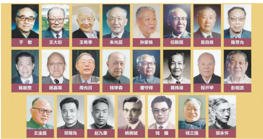
“两弹一星”先进群体像。

郭永怀回国后，便投身于我国“两弹一星”的建设。1968年12月5日，郭永怀在完成第一次热核弹头试验准备工作返回北京时，因飞机着陆失事不幸遇难。