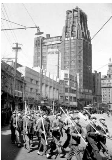
“南京路上好八连”战士们参加劳动归来(资料照片)。