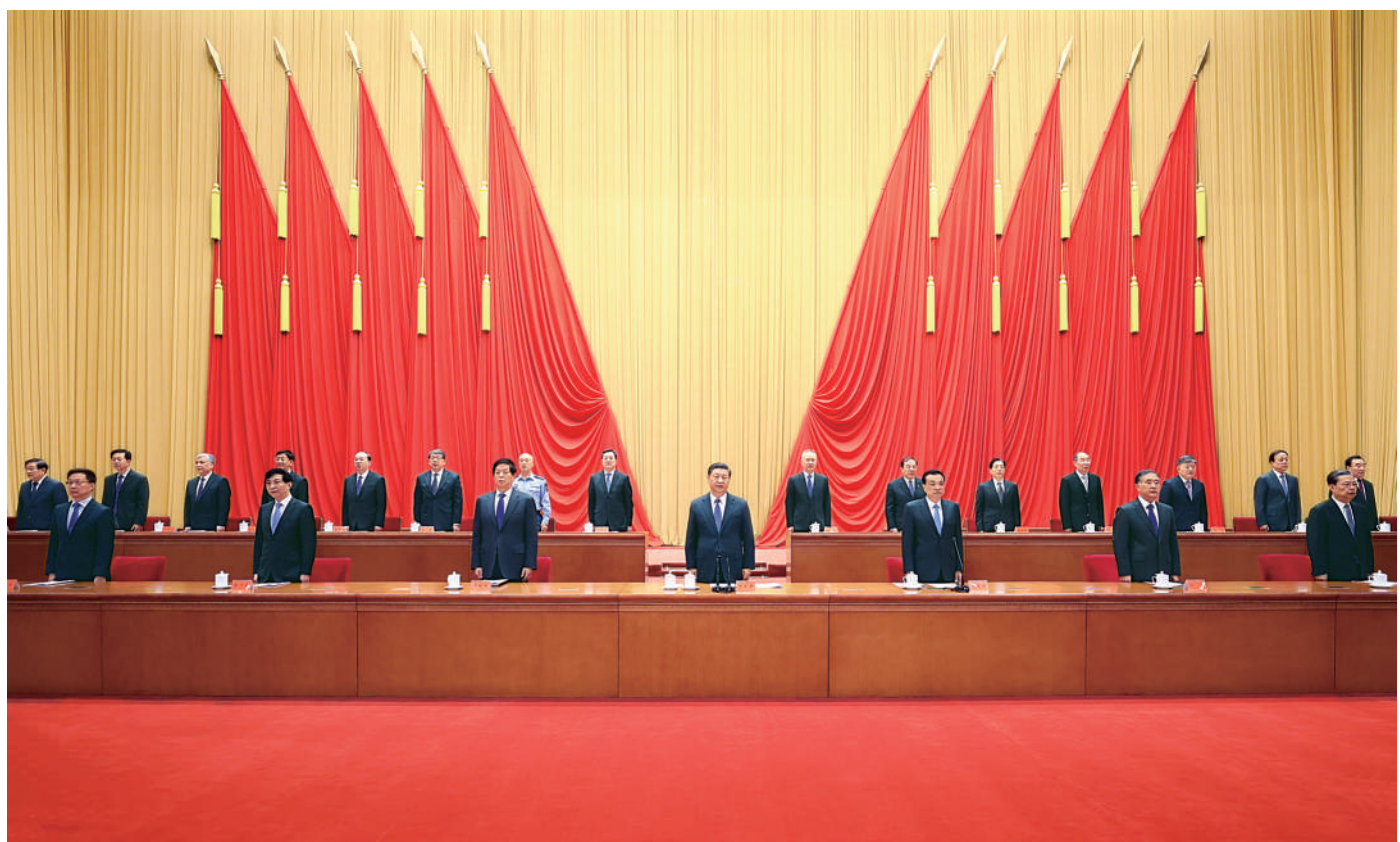
5月28日，中国科学院第二十次院士大会、中国工程院第十五次院士大会和中国科学技术协会第十次全国代表大会在北京人民大会堂隆重召开。中共中央总书记、国家主席、中央军委主席习近平出席大会并发表重要讲话。