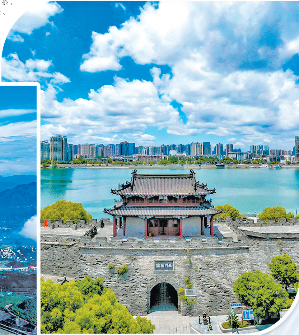
上图 襄阳市古城一角。作为汉江生态经济带中心城市，襄阳的辐射带动作用日益显现。