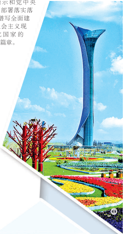
图① 图为沈阳世博园进入花季的美丽景象。 本报记者 孙潜彤摄 图② 辽宁加快推进沿海经济带开发开放，畅通海陆空网四位一体国际大通道。图为锦州锦州港一角。 万 重摄 图③ 辽宁重大装备在国民经济各领域撑起“大国重器”的脊梁。图为沈阳北方重工集团盾构机装配车间。 赵敬东摄 图④ 近年来，辽河水水质逐渐好转，图为辽河湿地景观。 本报记者 孙潜彤摄

站在新的历史起点，我们将以习近平新时代中国特色社会主义思想为指导，从党史学习教育中汲取奋进力量，大力破除形式主义、官僚主义之弊，激励广大干部群众带头抓落实、善于抓落实、层层抓落实，清单化明责、精细化管理、项目化推进、闭环化抓实，坚决把习近平总书记重要指示和党中央决策部署落到实处，谱写全面建设社会主义现代化国家的辽宁篇章。