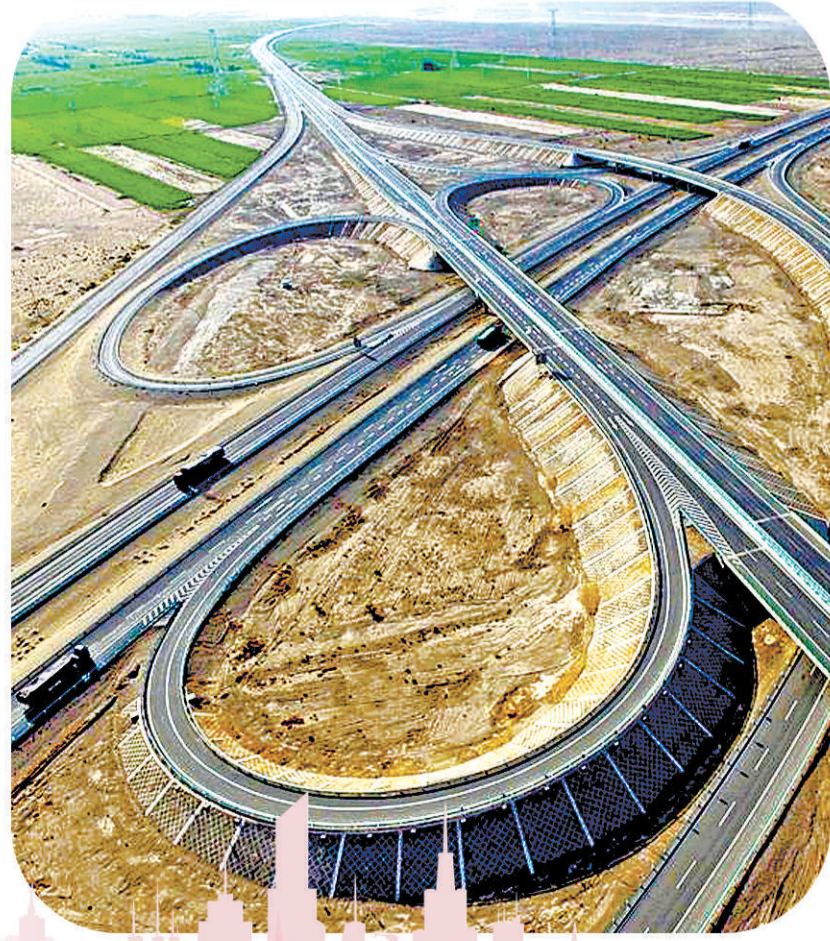
右下图 京新高速公路和连霍高速公路在新疆哈密骆驼圈子相交的立交桥,京新高速由此和连霍高速共线。