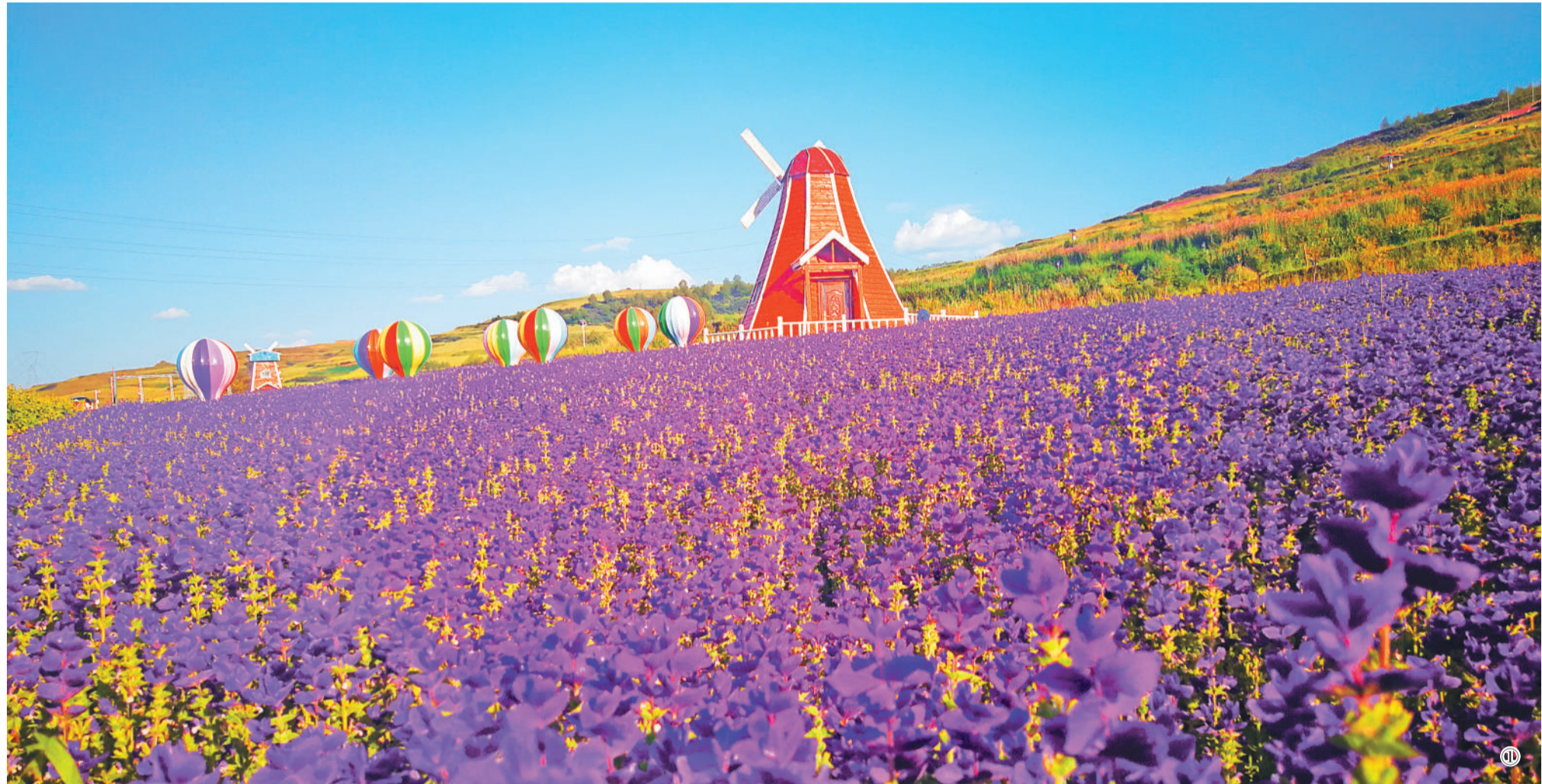
图① 青海省西宁市湟中区上山庄村花海景区。