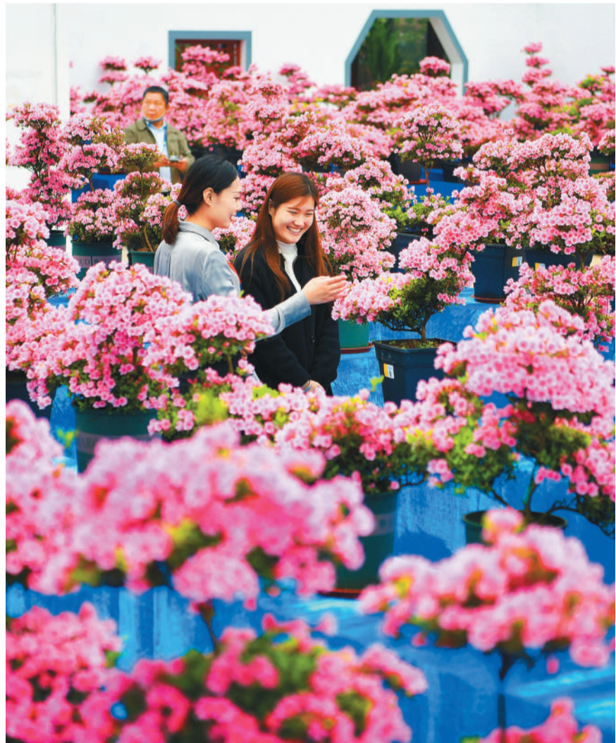
近日，山东省日照市中国杜鹃花博览园，市民在欣赏盛开的杜鹃花。日照市培育打造高质量文旅项目，建成运营了东夷小镇、中国杜鹃花博览园、海洋公园等一批文旅项目，助力当地旅游经济高质量发展。