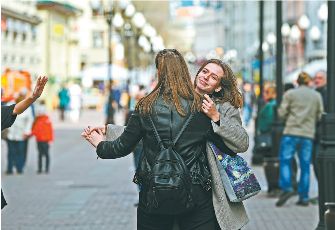
图为俄罗斯首都莫斯科老阿尔巴特街街头。