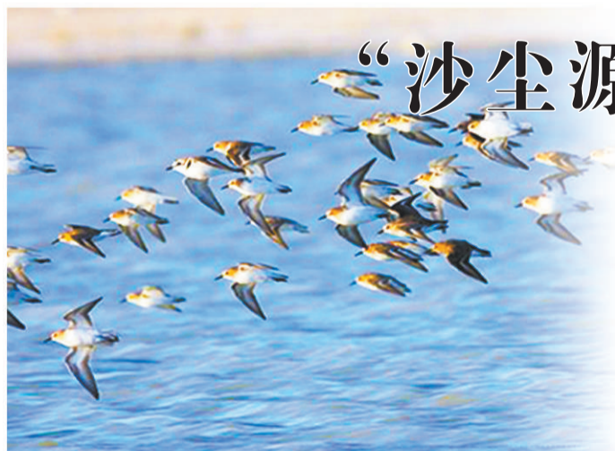
波光粼粼的艾比湖湿地正成为鸟类嬉戏的天堂。