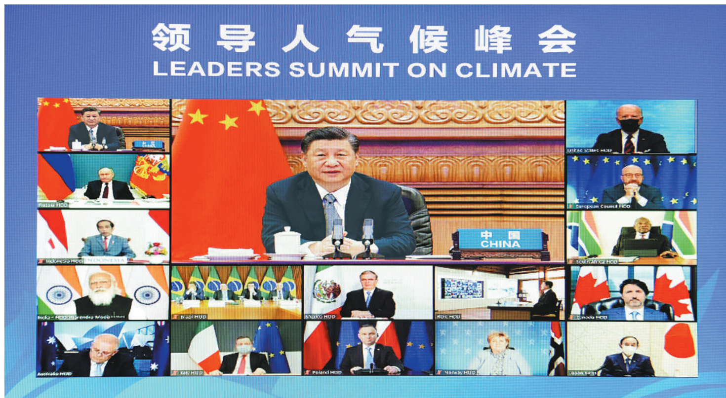
4月22日晚，应美国总统拜登邀请，国家主席习近平在北京以视频方式出席领导人气候峰会，并发表题为《共同构建人与自然生命共同体》的重要讲话。