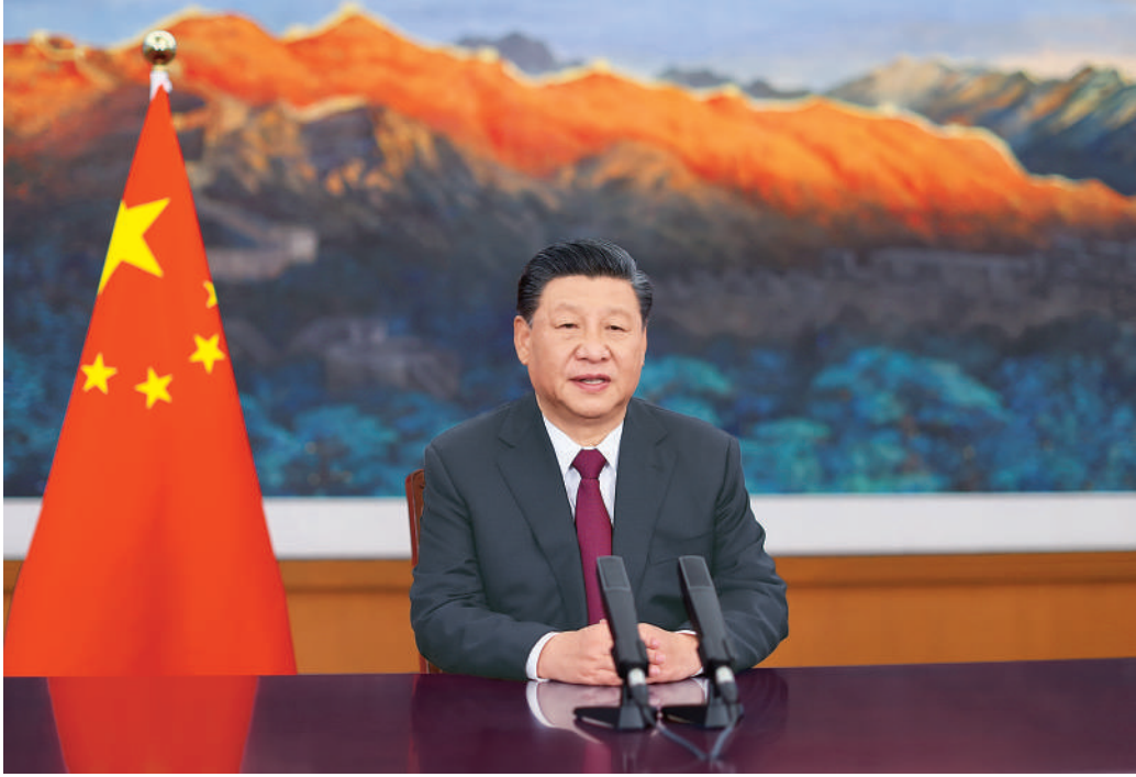
4月20日上午,博鳌亚洲论坛2021年年会开幕式在海南博鳌举行,国家主席习近平以视频方式发表题为《同舟共济克时艰,命运与共创未来》的主旨演讲。

新华社北京4月20日电 博鳌亚洲论坛2021年年会开幕式20日上午在海南博鳌举行,国家主席习近平以视频方式发表题为《同舟共济克时艰,命运与共创未来》的主旨演讲。 习近平指出,博鳌亚洲论坛成立20年来,见证了中国、亚洲、世界走过的不平凡历程,为促进亚洲和世界发展发挥了重要影响力、推动力。当前,百年变局和世纪疫情交织叠加,世界进入动荡变革期。我们所处的是一个充满挑战的时代,也是一个充满希望的时代。人类社会应该向何处去?我们应该为子孙后代创造一个什么样的未来?对这一重大命题,我们要从人类共同利益出发,以负责任态度作出明智选择。中方倡议,亚洲和世界各国要回应时代呼唤,携手共克疫情,加强全球治理,朝着构建人类命运共同体方向不断迈进。 ——我们要平等协商,开创共赢共享的未来。应该坚持