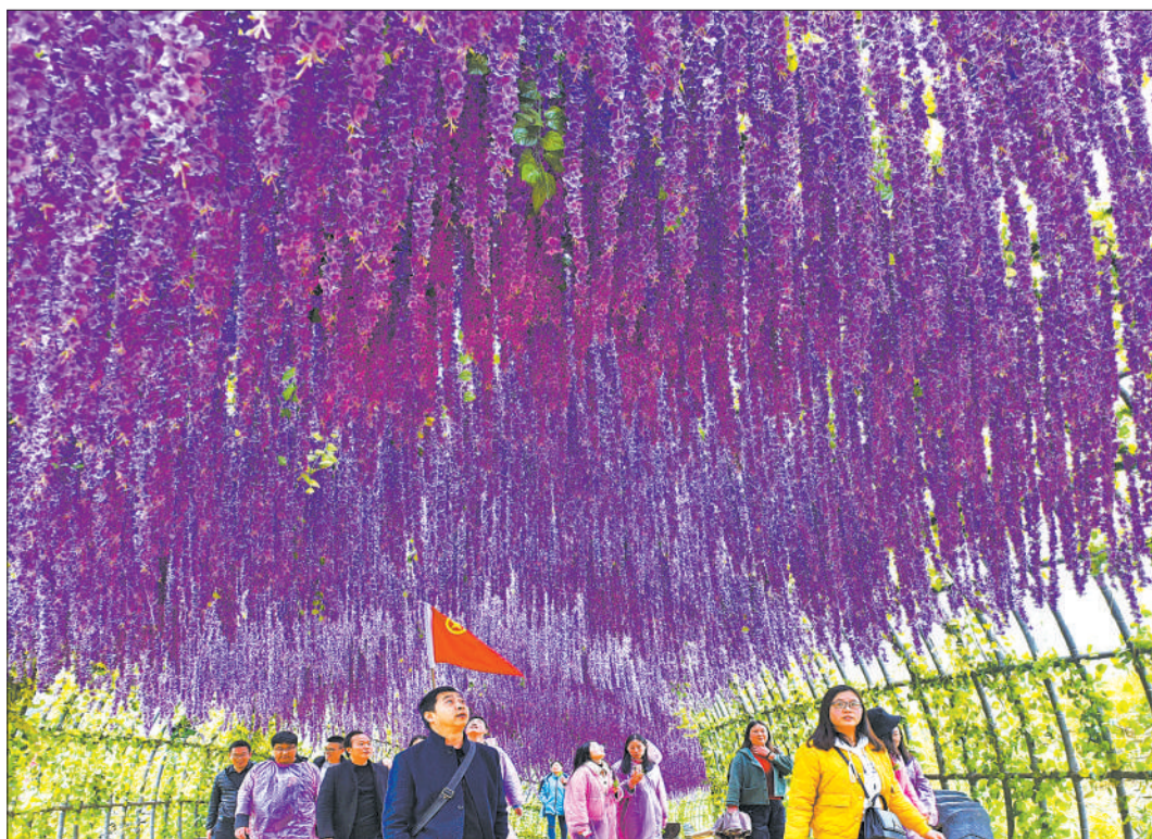
▼游人在重庆市酉阳土家族苗族自治县板溪镇杉树湾村休闲农业示范园区游览观光。近年来，该县着力打造集花海观光、休闲度假、乡村艺术于一体的休闲农业示范景区，拓展村民增收渠道。