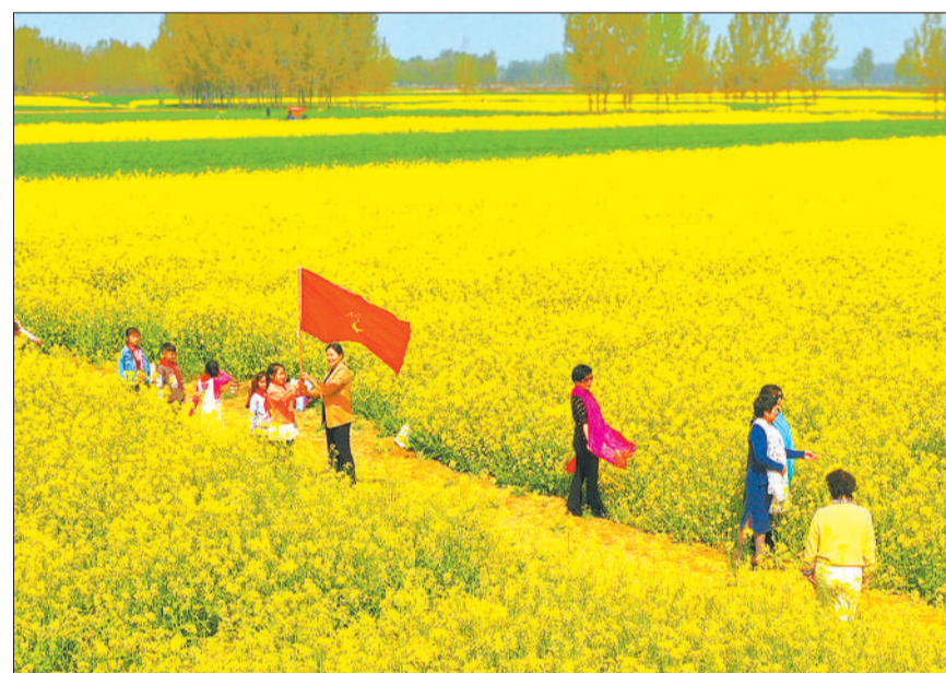
▼江西省宜丰县石市镇鲁盛富硒蔬菜产业园，游客开心体验采摘乐趣。近年来，该县依托良好的生态环境和富硒资源，大力发展富硒有机农业和生态休闲农业产业，为市民提供观光、休闲、体验的好去处。