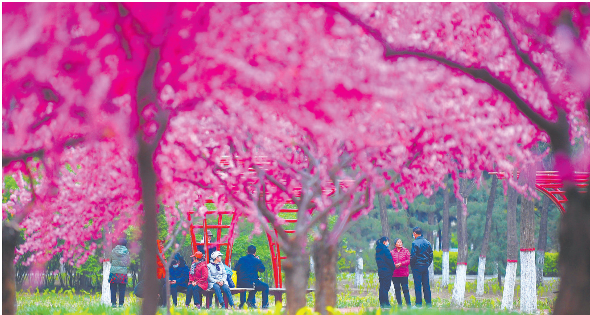
▲河北省迁安市近年来大力发展休闲农业和旅游观光产业，助民增收。

趁春色正好，一起去田野，在食宿、旅游、农业体验、加工等集聚而成的产业链中，感受当下的美好生活。