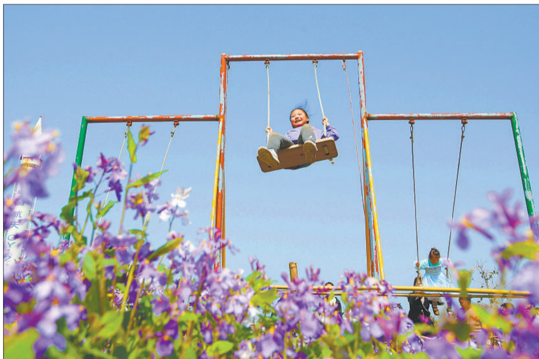
▲小朋友在江苏省泗洪县朱湖镇世外桃源休闲度假区桃园游乐场玩耍。近年来，泗洪县打造出近百个“农业+旅游”的农旅融合综合体，为游客提供观光、休闲、体验、教育等多种服务。