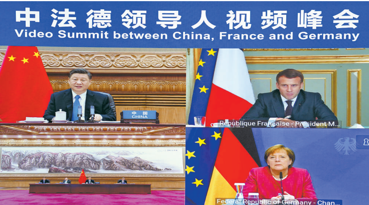
下图 4月16日下午,国家主席习近平在北京同法国总统马克龙、德国总理默克尔举行中法德领导人视频峰会。

新华社北京4月16日电 4月16日下午,国家主席习近平在北京同法国总统马克龙、德国总理默克尔举行中法德领导人视频峰会。三国领导人就合作应对气候变化、中欧关系、抗疫合作以及重大国际和地区问题深入交换意见。