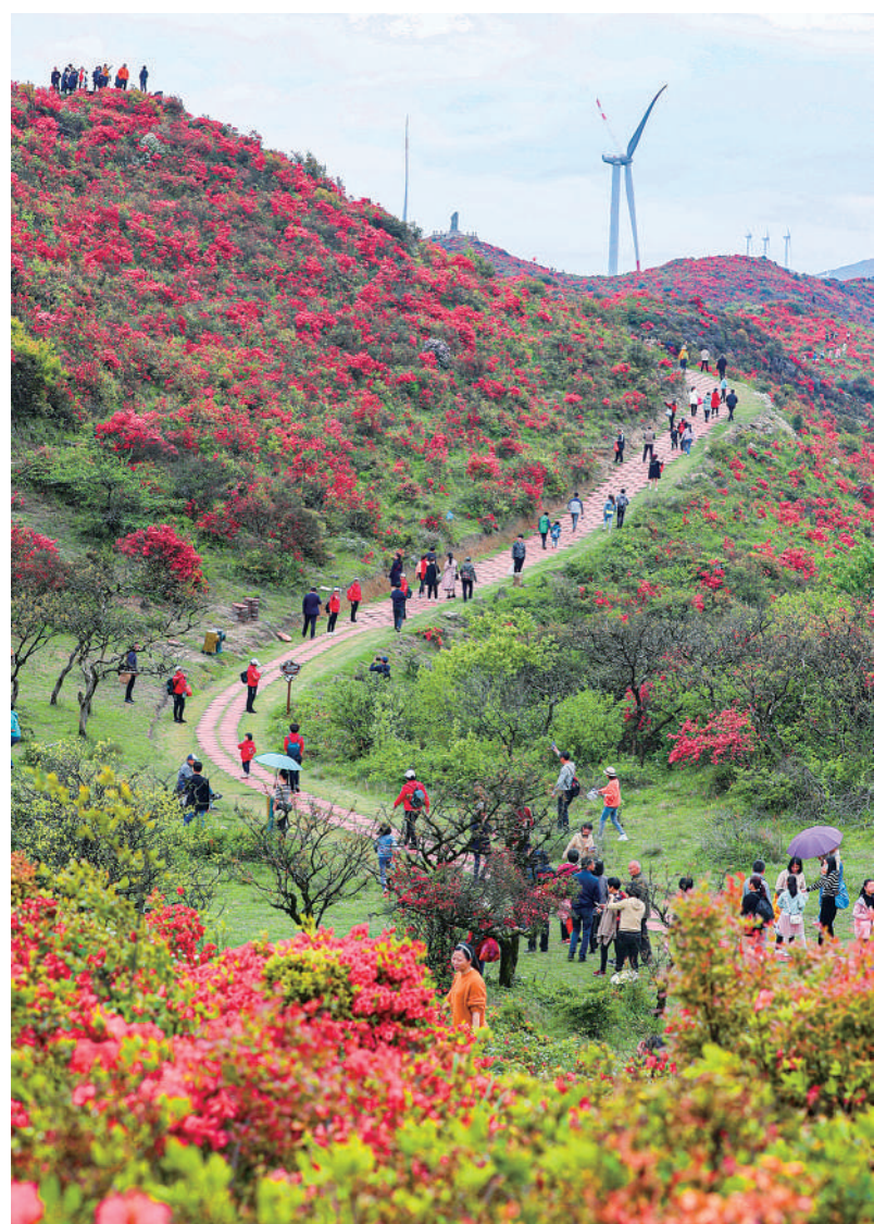
4月13日，游客在江西省广昌县牙梳山景区游览。连日来，牙梳山上杜鹃花竞相绽放，吸引了大批游客前来体验生态游。

愿母亲河永葆生机活力 6版 新能源车何时能有专属保险 8版 全面提高国家生物安全治理能力 12版