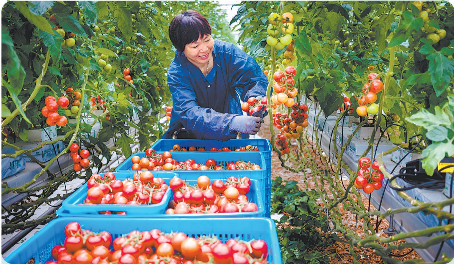
上海金山区现代农业产业园内上海金塘农业科技发展有限公司的番茄种植基地里,工作人员正在采摘小番茄。