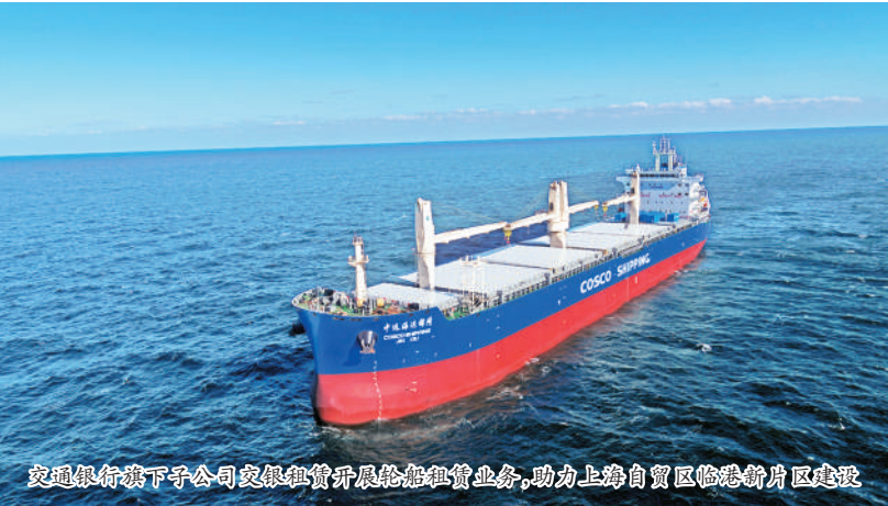
交通银行获下子公司交银租赁开展绿色租赁业务,助力上海自贸区临港新片区建设