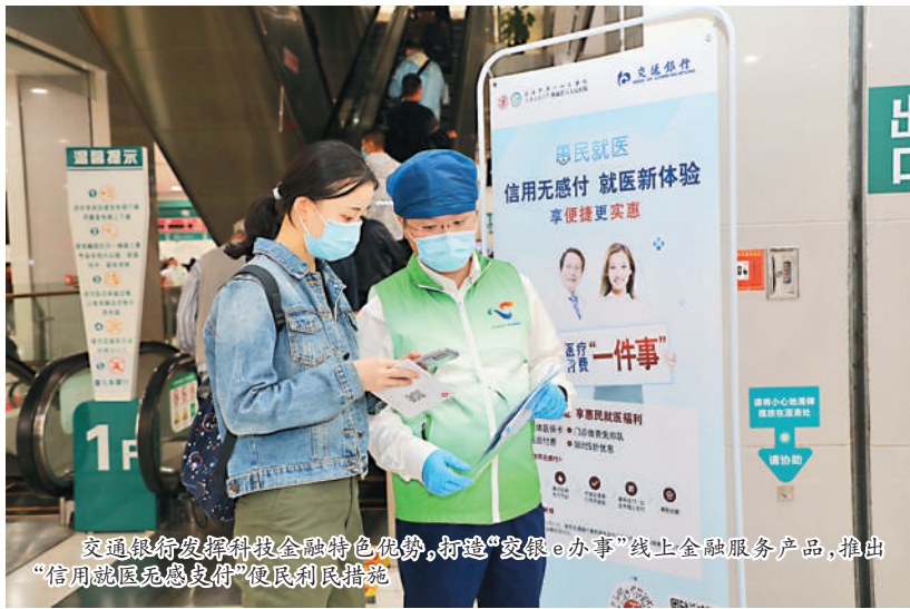
交通银行发挥科技金融特色优势,打造“交银e办事”线上金融服务产品,推出“信用就医无感支付”便民利民措施

展望2021年,疫情后的修复式增长有望带来宏观经济的“暖春回归”,“双循环”新发展格局的构建更为市场带来更大的增量空间。交通银行坚守战略定力、完善战略布局,坚持市场思维、价值思维、底线思维,通过金融科技的现代化演绎,推动经营管理“整体性转变、全方位赋能、革命性重塑”,发挥出在长三角一体化发展中的龙头引领作用,实现交行与实体经济共同发展。