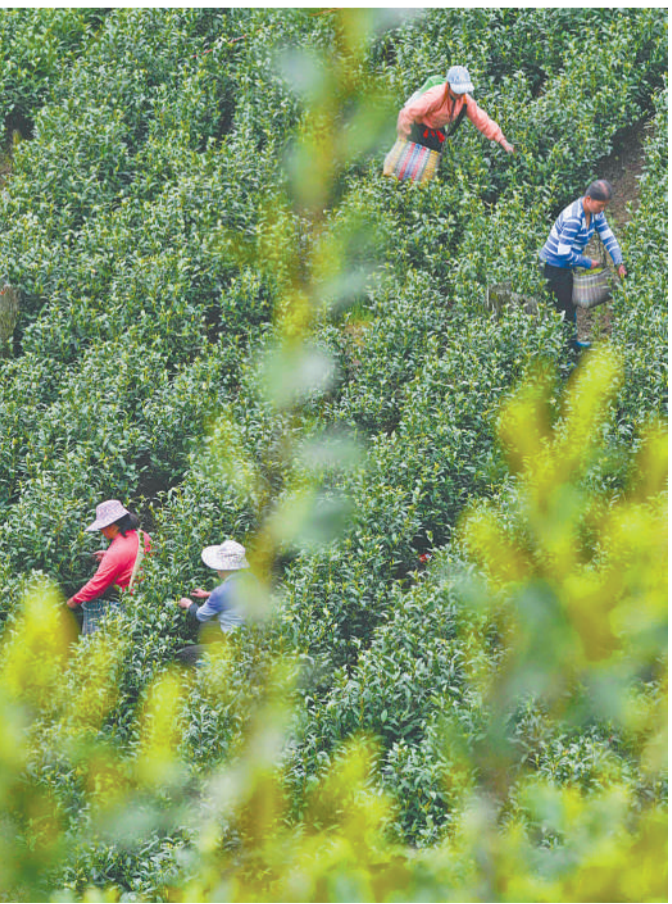
日前,在湖南省永州市江华瑶族自治县桥市乡,茶农正在采摘春茶。近年来,江华县大力盘活山地、林地发展茶叶产业,全县茶叶种植面积达7万余亩,共有茶叶加工企业48家,有力促进了农民增收。

据统计,2020年,平度市固定资产投资支撑项目从285个增加到516个,已开工项目从146个增加到465个,青平两级重点项目开工率97%、投资完成率100%,新开工纳统项目达到431个,是2019年纳统项目总数的1.57倍。