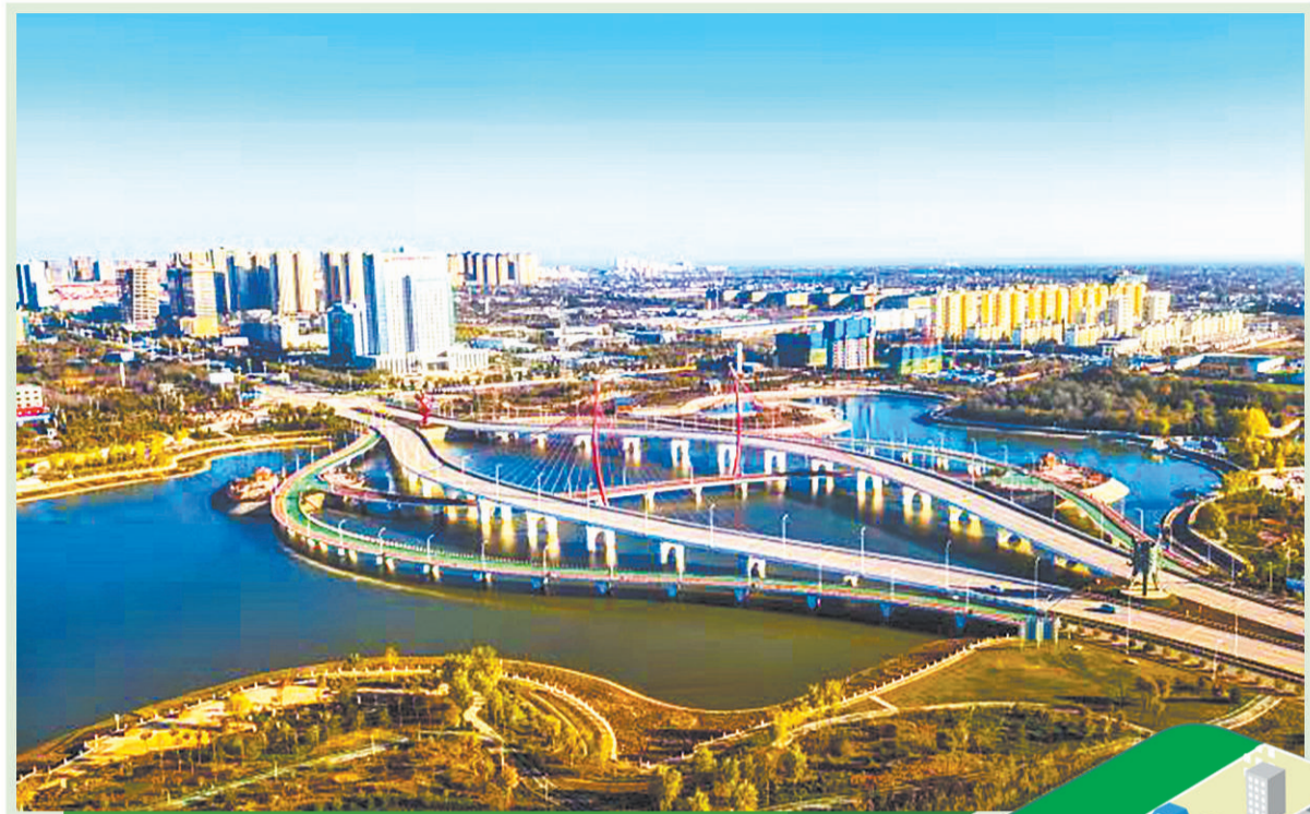
甘肃省庆阳市西峰区南湖雨洪集蓄项目。