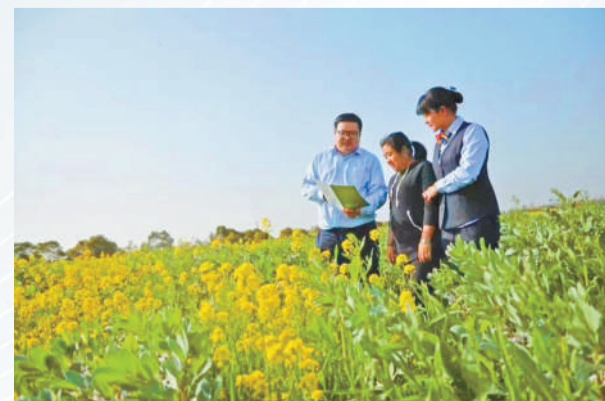
邮储银行上海奉贤区支行信贷员为客户介绍“家庭农场贷款”业务