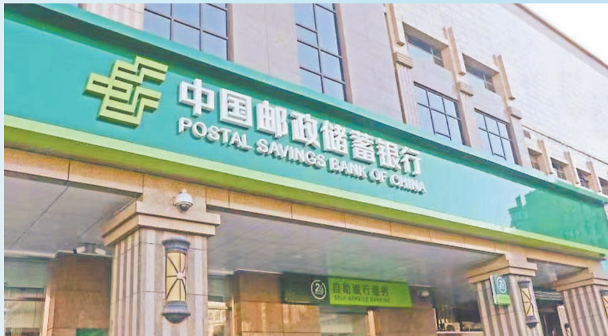
邮储银行营业网点

上海分行在认真落实国家相关部门的2个金融创新项目的基础上,发挥邮政集团三流合一、板块协同的优势,以邮储银行为主导,配套叠加邮政服务的综合金融服务模式,制定邮银产品服务包,集邮政集