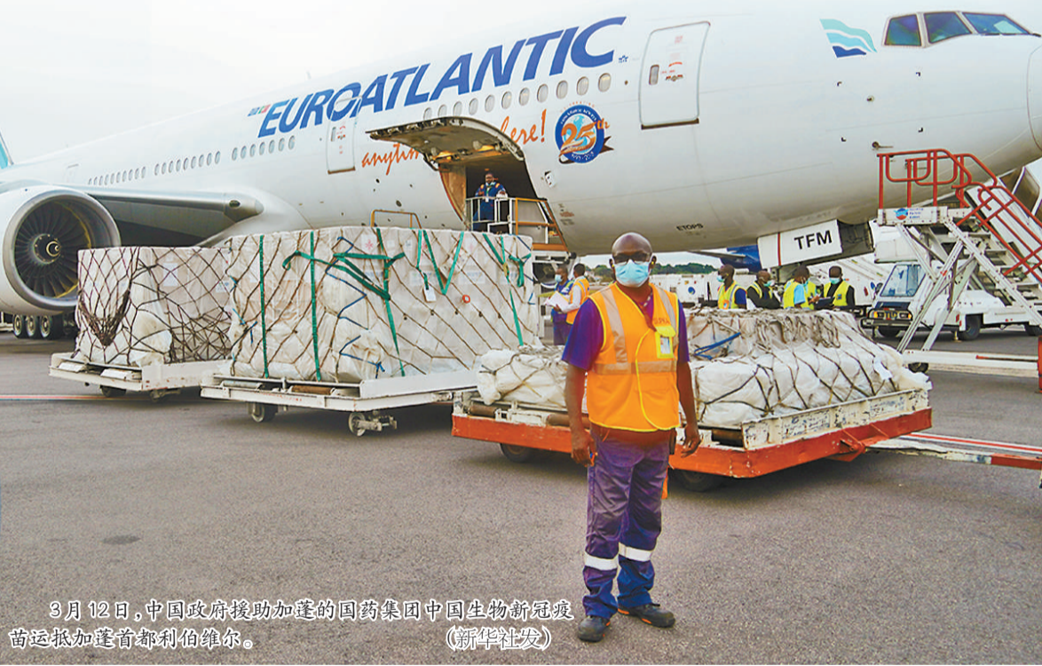
9月12日,中国政府援助加蓬的国药集团中国生物新冠疫苗苗运抵加蓬首都利伯维尔。