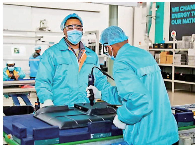
在南非开普敦郊外的海信亚特兰蒂斯工业园,两名当地员工正在流水线上组装电视。该工业园由海信集团和中非发展基金共同投资建设,在促进非洲本土制造业发展的同时,也为当地带来大量就业机会,创造许多外汇和税收收入。目前工业园生产的电视和冰箱产品在南非市场占有率排名第一,并出口到10余个非洲国家。

本报北仑特约记者(记者田士达)日前,联合国大学与荷兰格罗宁根大学4名学者联合发表论文指出,制造业持续带动非洲国家就业,但制造业产值增速逊于经济增速。随着非洲自贸区启动,未来非洲制造业有望延续发展趋势。