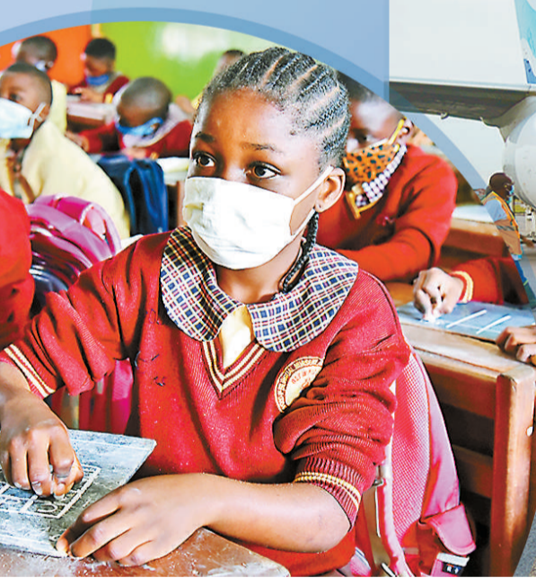
戴口罩的学生在喀麦隆首都温得一所小学上课。