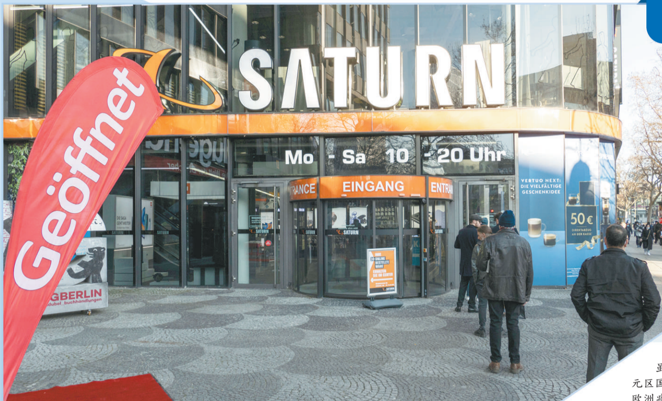
3月9日,人们在德国首都柏林排队等候进入一家商店。柏林部分非必需日用品零售商店有条件恢复营业。