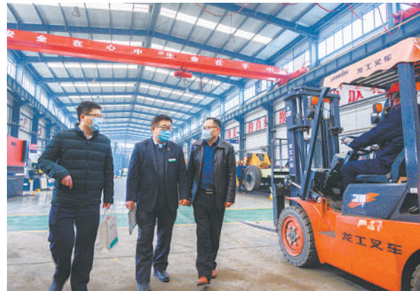
中国农业银行山东省分行通过信贷支持山东东大动力科技有限公司自行设计制造“公铁两用液压牵引车”。图为该行客户经理(中)上门了解企业经营情况，开展贷后管理服务。