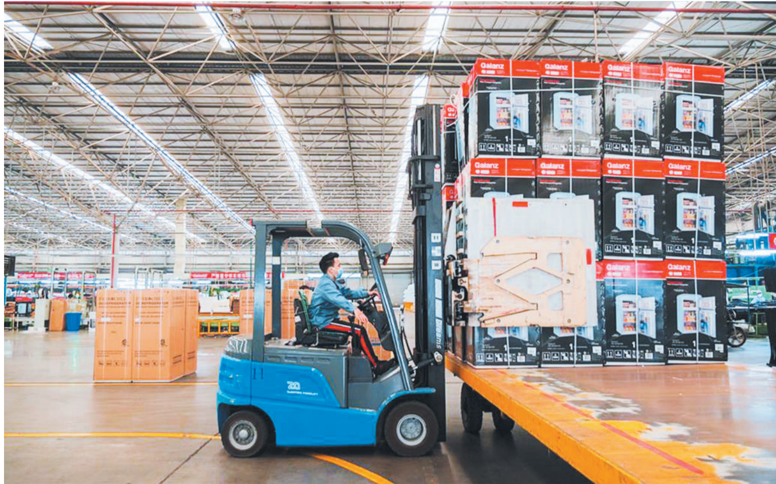
在位于格兰仕集团中山基地的冰箱制造车间,工人正在装运销往美国的整机产品。