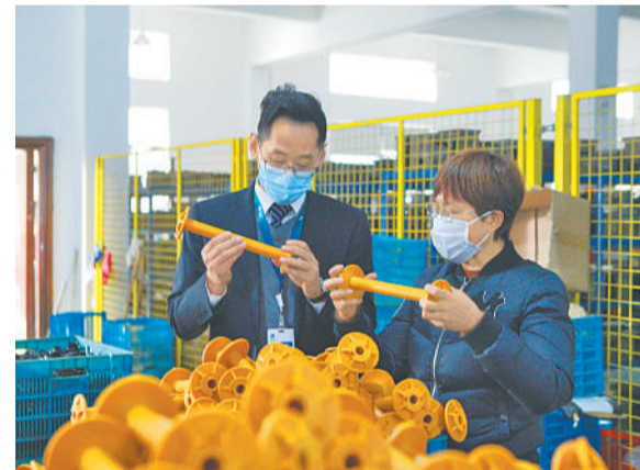
近日,浙江农信新昌农商银行工作人员(左一)来到新昌县新盛塑料制品厂开展进企业送金融服务活动。去年,该行在当地监管部门指导下,已发放复工复产专项再贷款25.48亿元,为915笔涉及92927万元贷款施行延期还本付息措施,累计减费让利超过1亿元。