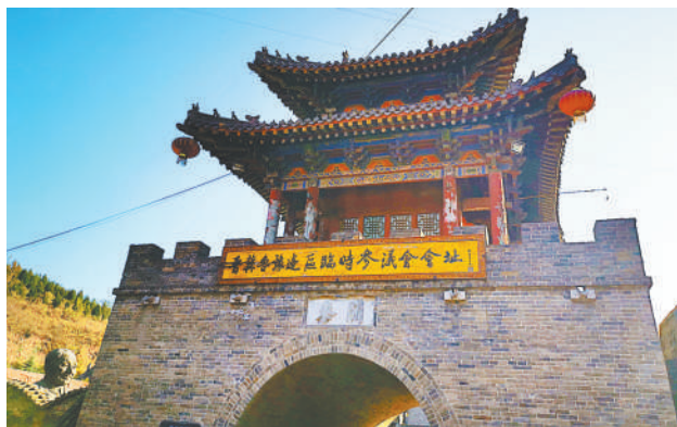
上图 位于山西省晋中市左权县的晋冀鲁豫边区临时参议会会址。

位于山西省长治市武乡县的八路军太行纪念馆。馆前伫立的是八路军将领群像“太行山”。(资料图片)