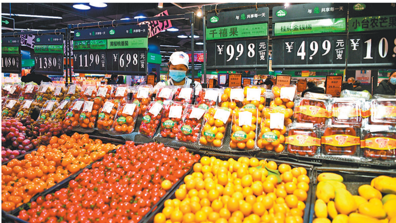
2月2日,在湖北省咸宁市通城县一家超市,顾客正在选购商品备年货。春节临近,为保证市场供应,通城县各大市场、商店超市,严格做好疫情防控,给广大市民备足年货,欢欢喜喜过大年。

据悉,中央有关部门已批准海南省增加6家免税店,通过充分的市场竞争和市场化手段满足消费者多样化消费选择的需求。6家新店中,海旅免税城、中服三亚国际免税购物公园和三亚凤凰机场免税店等3家位于三亚的免税店已于2020年12月30日开业;海控全球精品(海口)免税城一期和海口观澜湖免税城已于1月31日开业。