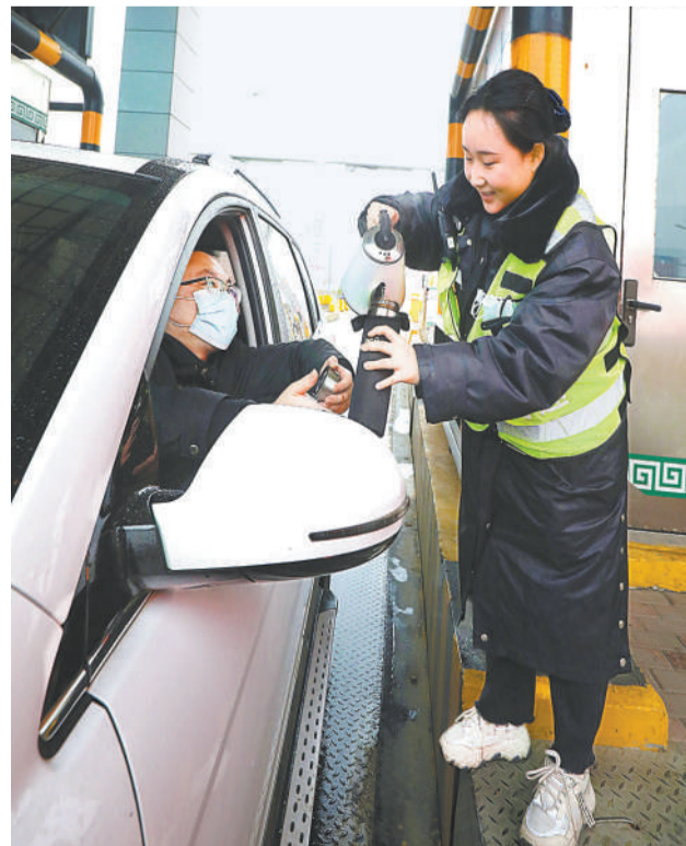
1月27日，大广高速江西吉安段宜丰收费站工作人员为司机添加开水。春运临近，该县各高速公路收费站推出多种举措，服务过往司机。

去年规模以上工业企业利润增长百分之四点一 企业盈利快速企稳持续向好 本报记者 熊丽