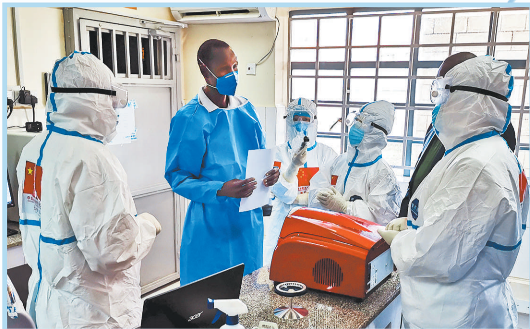
2020年8月21日,在南苏丹首都朱巴的一处新冠病毒检测机构,中国抗疫医疗专家组成员与南一线医护人员交流。

性的发展。德国《南德意志报》刊文指出,习近平主席在致辞中表示,人类面临的所有全球性问题,任何一国想单打独斗都无法解决,必须开展全球合作。习近平主席还呼吁各国加强疫苗研发、生产和分配合作。文章专门提到,习近平主席在致辞中呼吁各国摒弃冷战思维,在相互尊重、求同存异基础上实现和平共处。