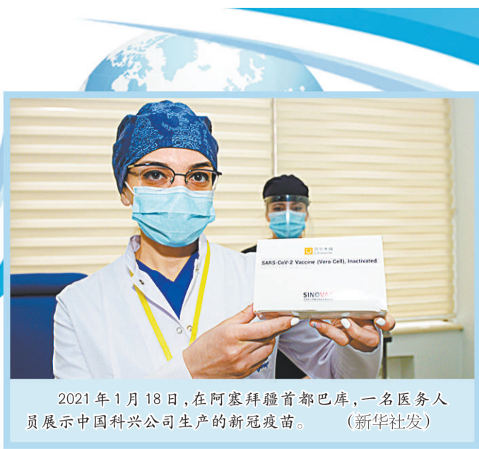
2021年1月18日,在阿塞拜疆首都巴库,一名医务人员展示中国科兴公司生产的新冠疫苗。

中国国家主席习近平1月25日晚在北京以视频方式出席世界经济论坛“达沃斯议程”对话会并发表特别致辞。海外媒体称习近平主席的重要讲话阐明了这个时代面临的四大课题,警告了“伪多边主义”“新冷战”对人类社会的危害,呼吁全球加强团结合作,捍卫和弘扬多边主义,推动构建人类命运共同体,为全球治理合作指明了方向。