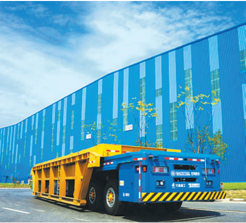
中国宝武宝钢股份上海宝山基地的无人驾驶重载框架车及无人仓库。（资料图片）

近日，中国宝武钢铁集团有限公司在纪念中国宝武130年大会上宣布：“中国宝武2020年粗钢产量实现亿吨，问鼎全球钢企粗钢产量之冠。” 中国宝武积极承担国家使命，一些高端产品在国内外市场已经占据主导地位，在核电用钢、航空航天材料、国家重大工程需求等领域完成一系列关键材料开发与制造，研发拥有了1000余个新产品牌号，其中30余个牌号实现全球首发，替代进口量1500多万吨。中国宝武宝山钢铁股份有限公司的汽车板品种全球覆盖度最全，国内市场份额持续保持在50%以上；是全球首个能同时批量生产第一、二、三代先进超高强钢的钢铁企业，也是世界上产量最高、品种最全、最具竞争力的硅钢生产企业。 回顾中国宝武走过的光辉历程，1890年，江南制造局炼钢厂和汉阳铁厂诞生，那是近现代中国钢铁工业的肇始，也是百年宝武的源头。新中国成立后，特别是改革开放以来，中国钢铁工业加速发展、做优做强，实现了从量变到质变的提升、从引进到引领的飞跃。近年来，中国宝武自主研发的系列高端产品已处于国际先进水平，解决了一批“卡脖子”材料难题，有力支撑了我国高端制造业和国家重大工程。 中国宝武钢铁集团有限公司党委书记、董事长陈德荣表示，中国宝武正在构建以绿色精品智慧的钢铁制造业为基础，新材料产业、智慧服务业、资源环境业、金融业等相关产业协同发展的产业格局，优化行业秩序、引导行业发展，积极推进联合重组、整合融合，加速创新驱动、转型升级，初步构建了具有宝武特色的现代公司治理体系。“今天的中国宝武，是中国近现代钢铁工业的历史传承者、中国今日钢铁工业之集大成者，也将努力做中国乃至全球钢铁业的未来引领者。” 据介绍，中国宝武已经吸纳了宝钢、武钢、马钢、八钢、韶钢、重钢、鄂钢、太钢等企业，形成了中国“钢铁航母编队”，在最新公布的《财富》世界500强企业中国，位列全球钢铁企业首位。