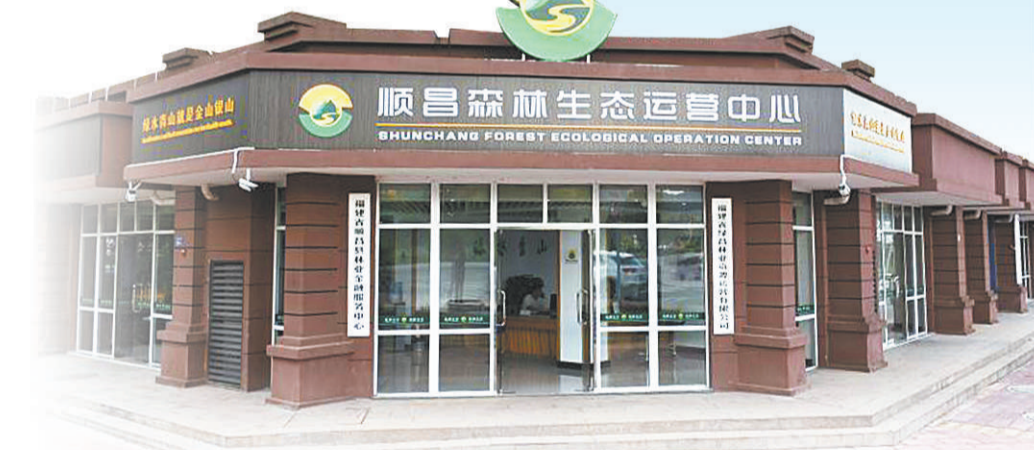
顺昌森林生态运营中心。

盘活生态资源最重要的一步，就是把精心准备好的优质“资源包”推向市场。吸引社会资本与专业化运营团队加入，壮大成产业，从而形成规模化、专业化、产业化运营机制，推动人才与资本要素进入乡村振兴和生态资源保护开发领域，