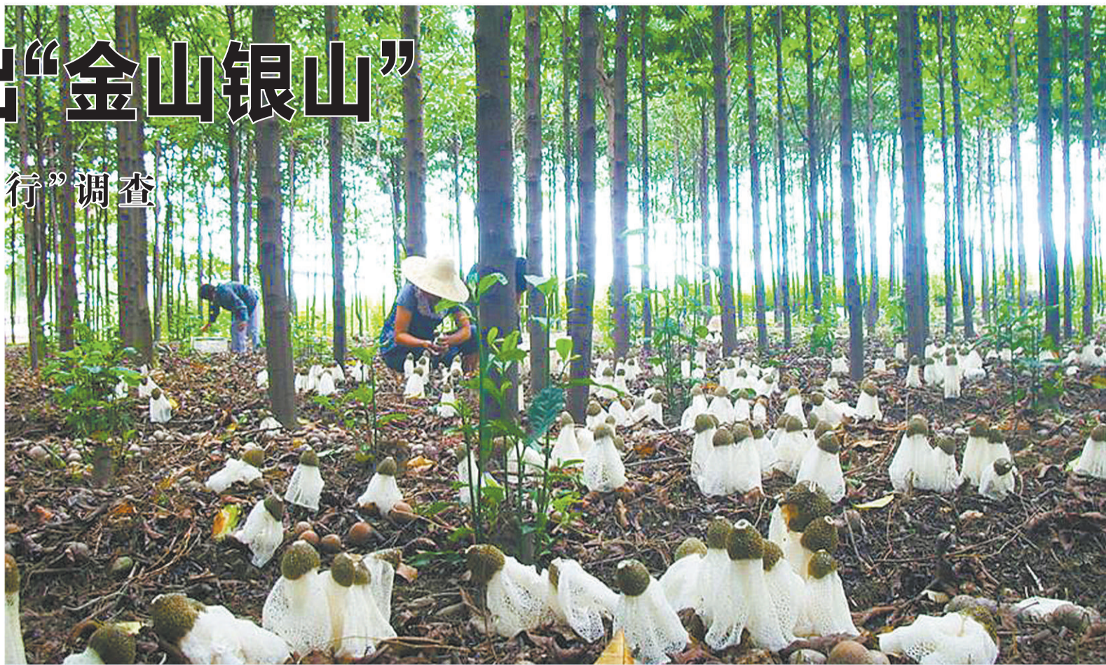
南平市农户林下套种竹荪喜迎丰收。

“在‘生态银行’建设上，如何因地制宜探索各种不同模式，特别是做好资源文章，一直是南平市探索实践的方向。”袁毅说：“可以以特色资源入股合作，也可以通过整合上市的途径推动武